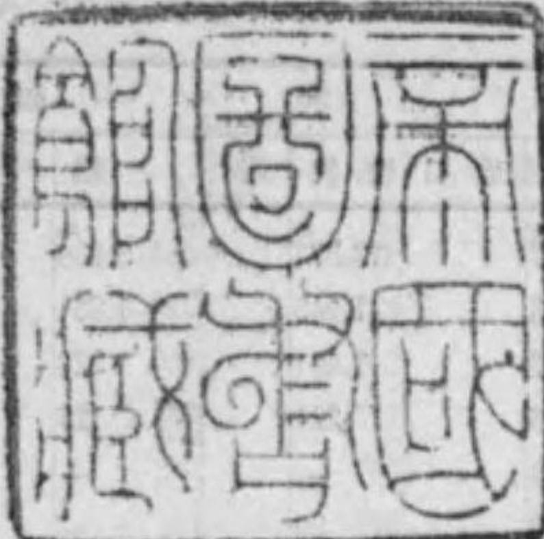
表 第 一 號