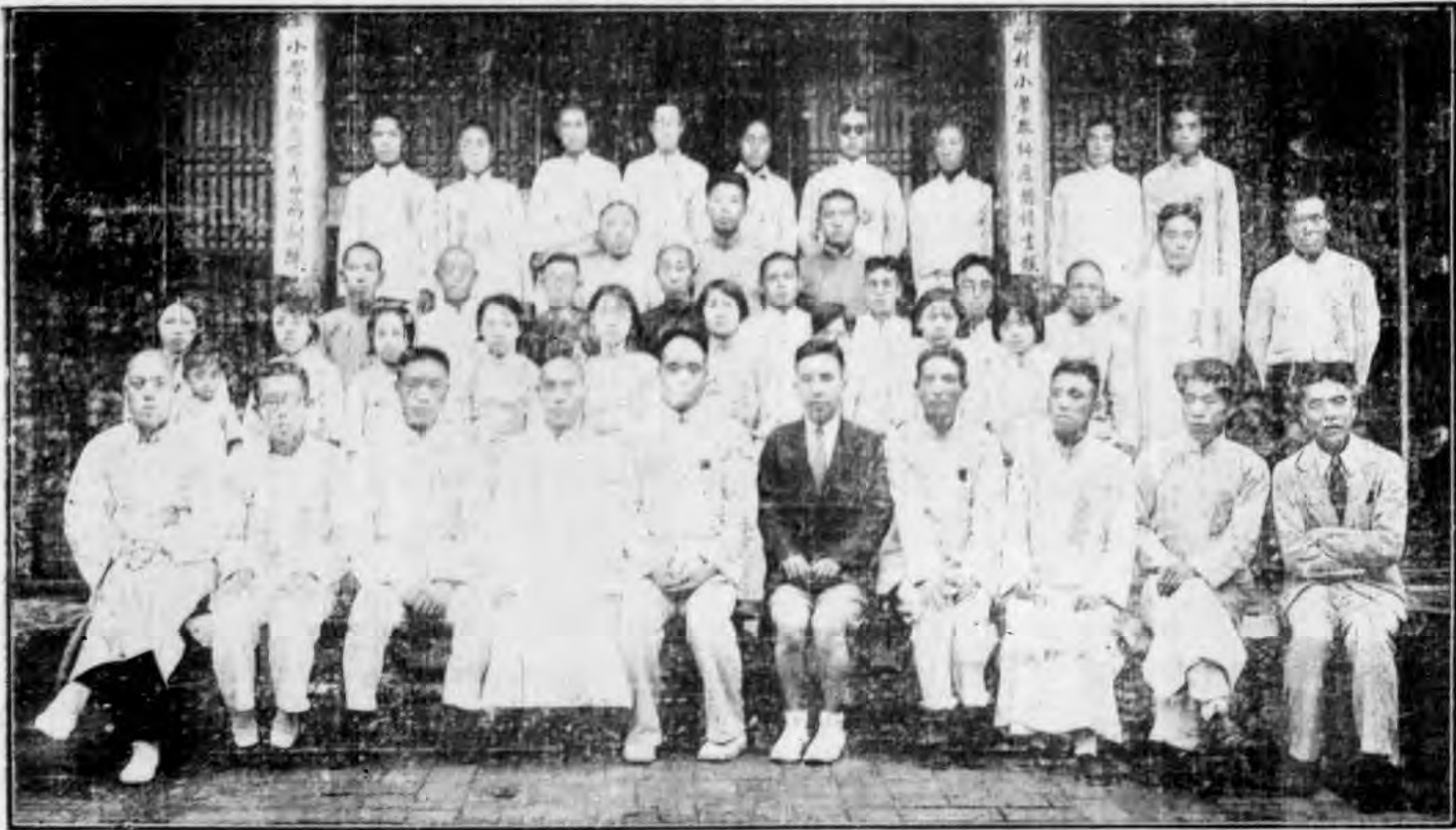
本館農建區小學教員暑期講習會開幕紀念