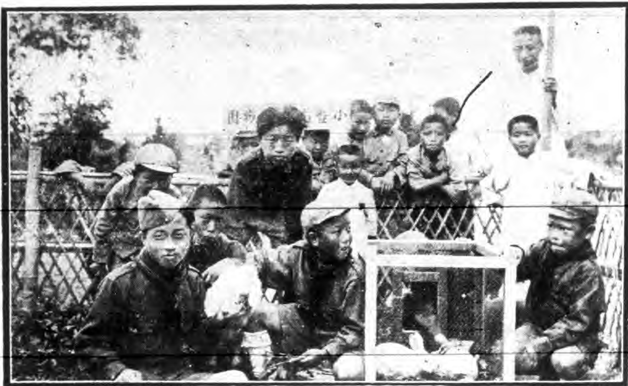
暨大實小小暨南市場動物園