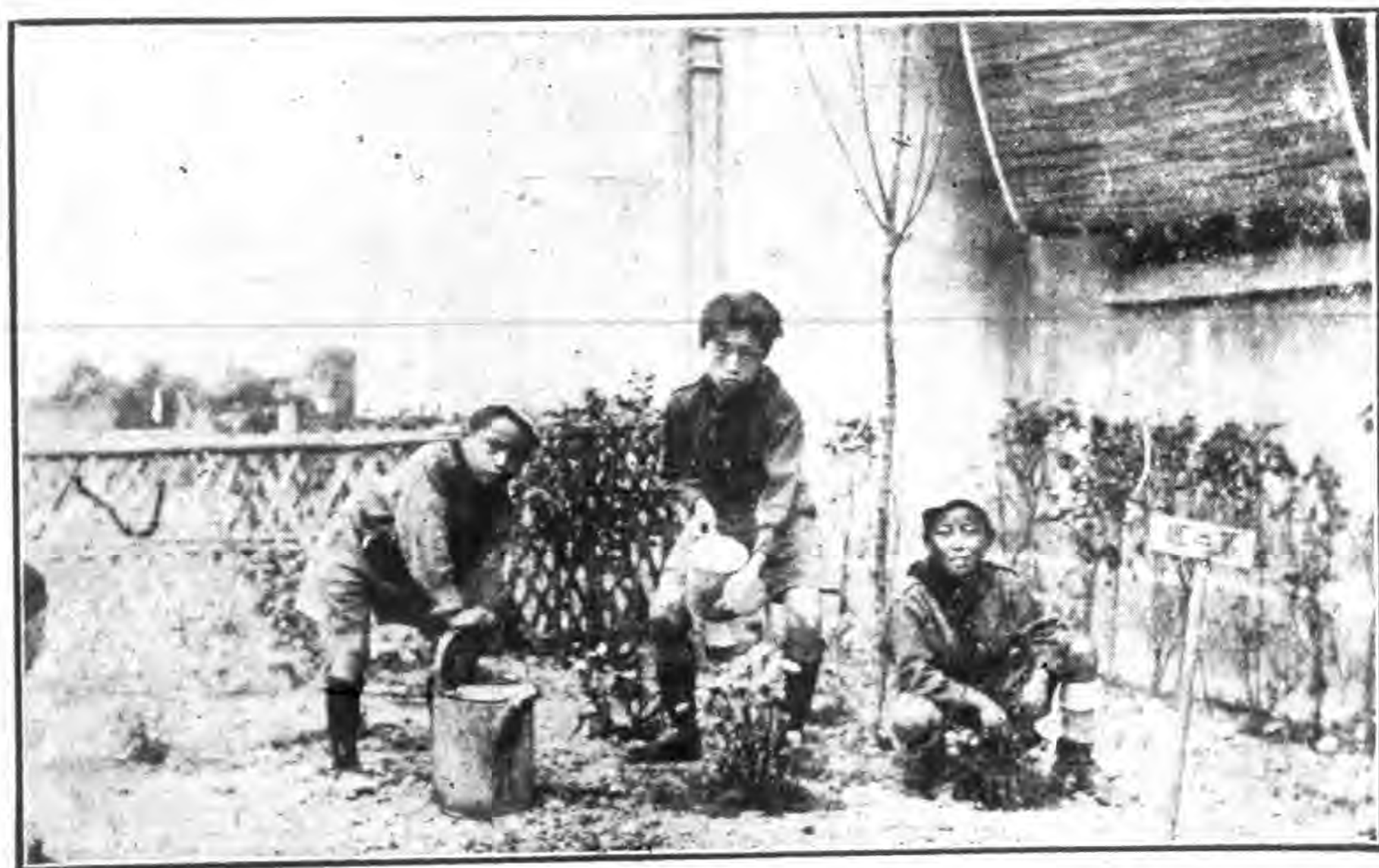
暨大實小小暨南市場植物園