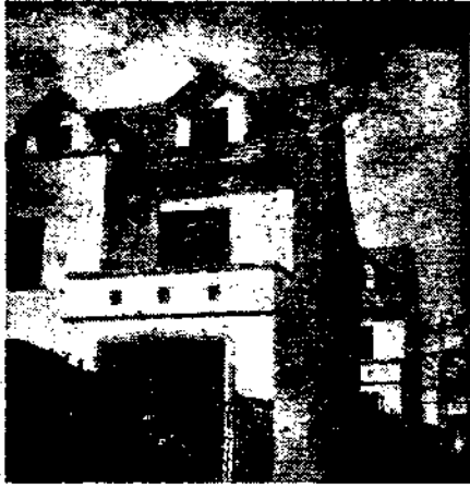
本公司新益一邨外景

該邨位於福履路台拉斯脫路最近落成地點通中二十二路公共汽車可以直達四週均為高等住宅環境優美不染塵夏 各宅均為三層雙開間式底層客室書房均合理想二樓臥室二間分配均勻三樓因東南臨空光線亦極充足可以遠眺高曠亦可用作正屋 各宅間維持寬闊地位陽光充沛空氣流通屋宇高爽佈置雅潔為標準之新穎住宅