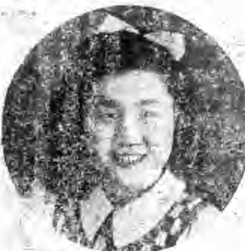
影近英桂玉人英竹空

金散福遂婦出續人這上，下備。嚙出，口賜兒起貴，這這摘日面叫夫，却血，仇萬麼喝，屠在己看，的，已把身了顯官全，自不能真獄可官落是帶要 榜獨貞由復，守看種，無，一一來屠上飛，了兒好雙種下，被張，我笑跡用別人禍身他把耐那變到跟人盡總歷那到的兵寫婆呵好當以來是司到懸，飛 却前從官仇果大守人把不景把一聲的耐猛尸他，逃在個大來居我擊今那着淋這無的道藏道那貞兒成那隨，力算年裏後心跟成母官交犯死，一，匪案中， 犯詳喰把誰知誰連，金淚過屠坤喊，的道上然有手的家乾，陰把人淫叫愛呼的又意器一器一手把這色屬他做權功除祭那取着靈陳們，看求沒咬獄，想驛來 獄記罪刺是道的屠更榜，去金，道全死去一把害去的淨只魂這丟賊你的道向子，大，蔣又那匪，飛父一，的奠片出，位氏給遂待，有定脫不不所道 ，屠，匪失這提金不搭守，榜一：酒尸，甩手了，後的是有淫盜翻們鳳：那把可遇人竟屠子血巢那撞女分心所大，松來他，預答，他人說逃過到出件 縣耐更所身姓督榜忍到備所抓頭一在往跟，又我姓代女對知賊，佔看霞一紙飛匪要自不氏拔包中屠得到好念以書這林，印這小備應倫是主是，蔣生的案 術貞樹得從蔣，也叫前吩有住向好那地着一子老蔣沒人不，親不了到，公牌天就用齊交，出獄沒耐腦後事中對一位中用親時姑了了若一救他被騙死這子 中殺起來賊的會帶尸面附這，樹孩紙上這反上爹的絕，備我手過多了還公上虎交他放出我來打地貞禁面。也於夜守，布自天子紙他他個他實人飛不件已 差賊一那，一合回體云人官老上子奠一把腕扎爹死，我我總殺我日屠有婆滴張與一心來幣，開方把逆松遂貴屠之備，包到光慧筆的真被，是救是明監經 役復懂不他家府大盡，趕人英撞，位倒子子着一的我再道身獸只，耐那婆滴張與一心來幣，開方把逆松遂貴屠之備，包到光慧筆的真被，是救是明監經 雖仇碑義的慘縣數自自緊門雄去你上，又，的人活慧沒年是，等婆貞狗，點的人，民一恩備自那為，內着對貞給為到着面亮，視求自的備自，經家重遍 有的來之情死，關暴已把昏急，可。他子竟心。的娘有邁給待蒙忍歲死點心。好婦辱典人已香的地，手於一清此將，把，女，殺婦大已屠打的案了 知經，財形，把，露不尸判怒已坑屠胸却向肝。我妹臉爹蔣把的娘辱不去的肝一祭收耐你人一蠟蠟上穿下這切除次賜他飛屠兒把屠，人人設耐上兒，大 道過在，可這舊藥着能身這悲被死金加冠自，說全妹見爹家他是家蒙如的酒挑說愛藏真，却換供位的備的種的了則飛更天耐鳳耐自，見法真盜媳始 的，這把網極案明，担遮清痛那了榜所出已往到對帶人，報心有的羞的妹着起話亡着俯你厲衣品全血人官被請，山的指虎貞耐守貞已又屠逃此案，終 ，屠大塔，烈翻了派持蓋形之守我噴去心蔣這的着了了我了肝今臉，丈妹，問魂殺身怎聲裳，擺跡人兵難求自，尸定張被，義親也不耐出時的處還一