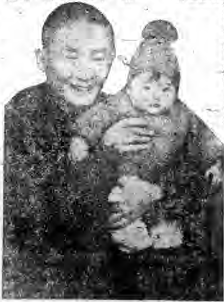
兒女孫外的他和鈴警洪星明且小