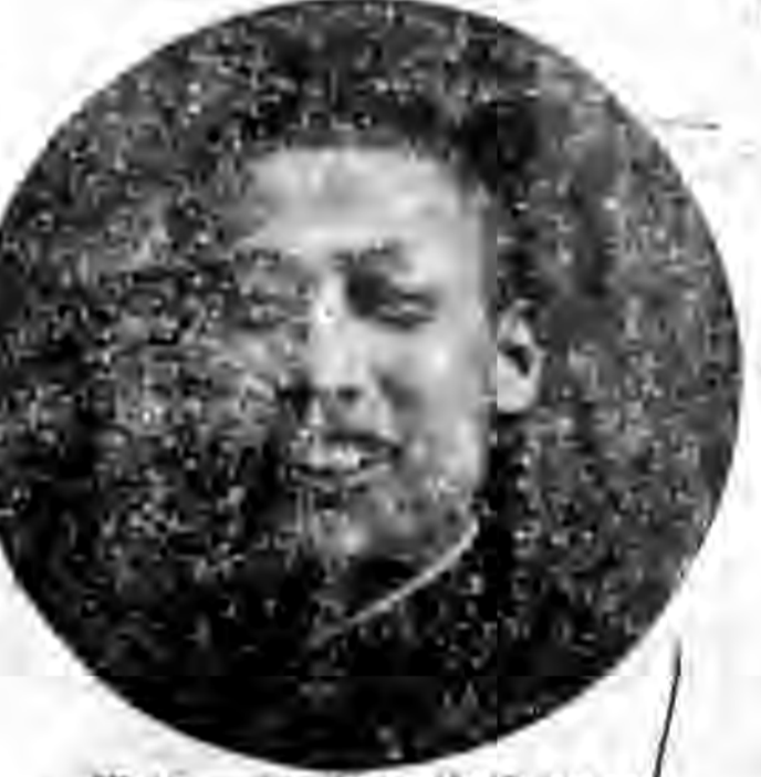
藉蕩二兄之藉蕩四三

玉壺春的新三 角 石頭 博無那嘯 津得前歌來 大唱月聲，唱 鼓唱月聲，唱 近的是彩以黃 些是是慶不台 年遠新從少 來學東上 一故北。唱 絕，來時過 之較喉二