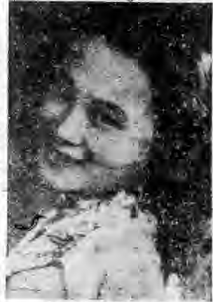
委非老不的燕燕陳

推行憲政影片 林彬客串主演 春風 在國定了南京紫金山置下田地，並在美 器到五到，便正好的攝影機器，聽說大部份 拍器到五到，便正好的攝影機器，聽說大部份 決定在沒有正式拍片之前，現在