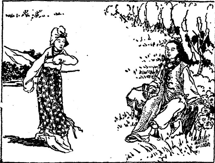
淵明微笑的抬起頭來，喊了一聲媽媽