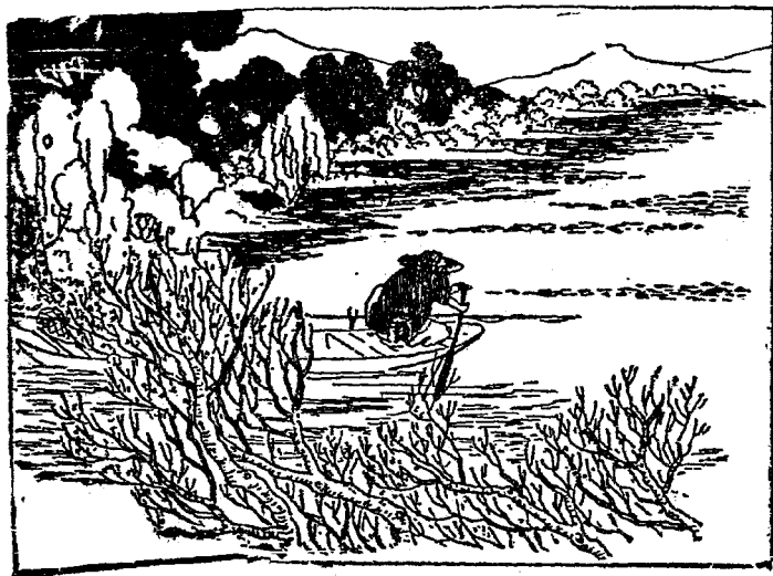
漁人出來之後找着，請的路處處便記着

知道的一一同他們 說了。那些人聽 了，皆嘆息惋嘆不 置。停幾日，漁人 走了。那裏的人們 同他說：「不要告 訴外面的人哪。」 漁人出來之後，找 着從前的路，便處 處記着，到府裏去 告訴太守有這樣一