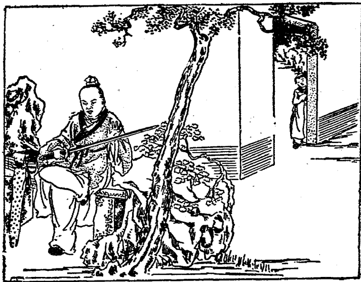
除了彈琴念書之外，還喜歡舞劍