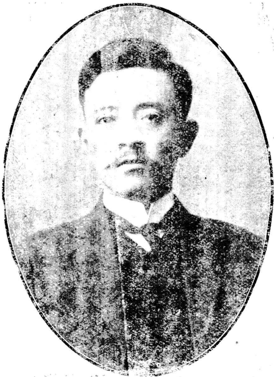
圖 三 宋 教 仁 像