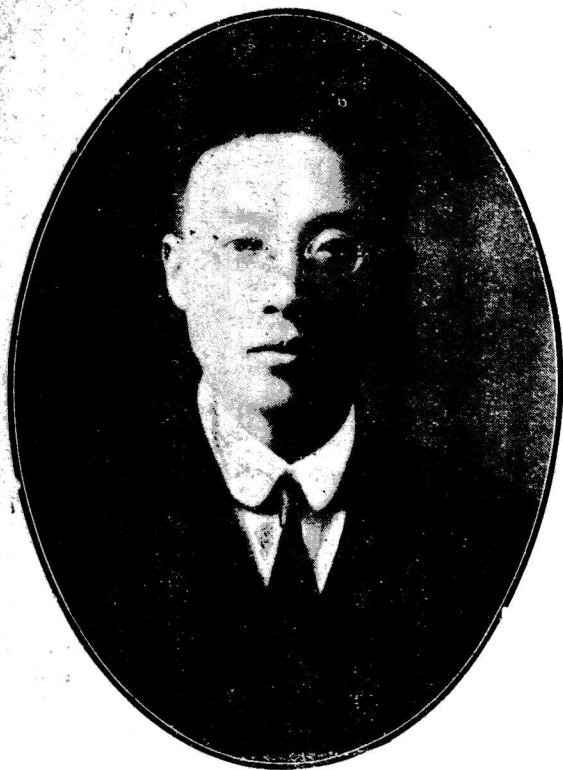
陳 英 士 像