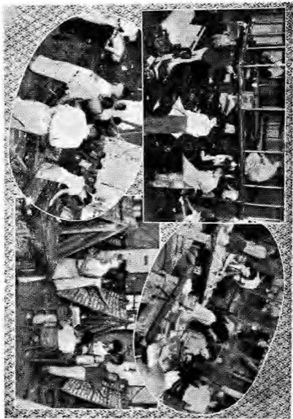
觀 內 社 本