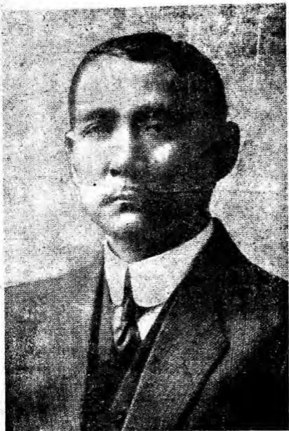
國 父 遺 像