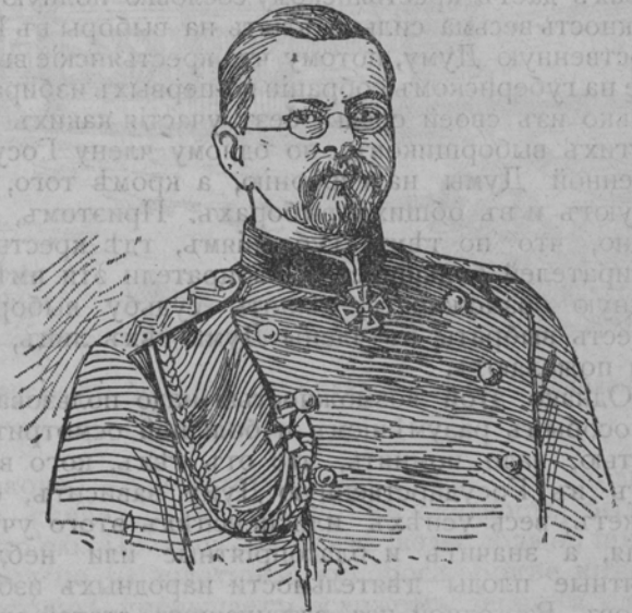
Военный министр генераль-лейтенантъ

Примите мои поздравленія и искреннюю признательность за ваши личныя энергическія усилія, приведшія мирные переговоры къ успѣшному окон-