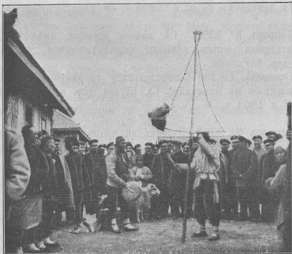
Китайскіе фокусники и жонглеры. (Фотогр. шт. ротм. Карпова, собств. корресп.).

Вопросъ № 3059. Можетъ ли быть унтеръ-офицеръ, ис-