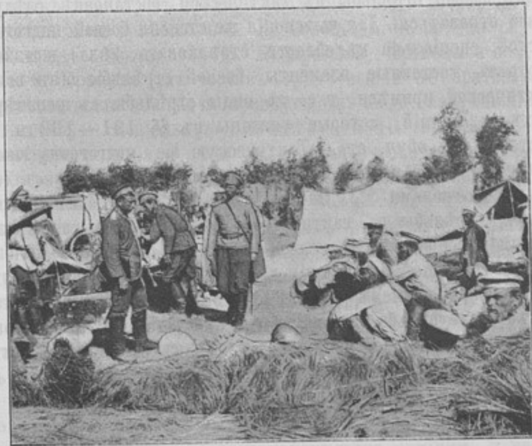
Больные уральцы у лазаретной линейки.

Данный мною отрицательный отвѣтъ на этотъ вопросъ вызвалъ со стороны нѣкоторыхъ читателей возраженіе: указываютъ, что въ подобномъ случаѣ командиръ полка долженъ былъ обратиться къ коменданту, приказаніе коего о допускѣ