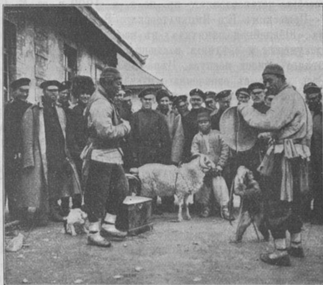
Китайскіе фокусники и жонглеры.

Вопросъ № 3062. Считается ли служба въ должности завѣдывающаго полковою швальнею за строевую при опредѣленіи права на поступленіе въ академію?