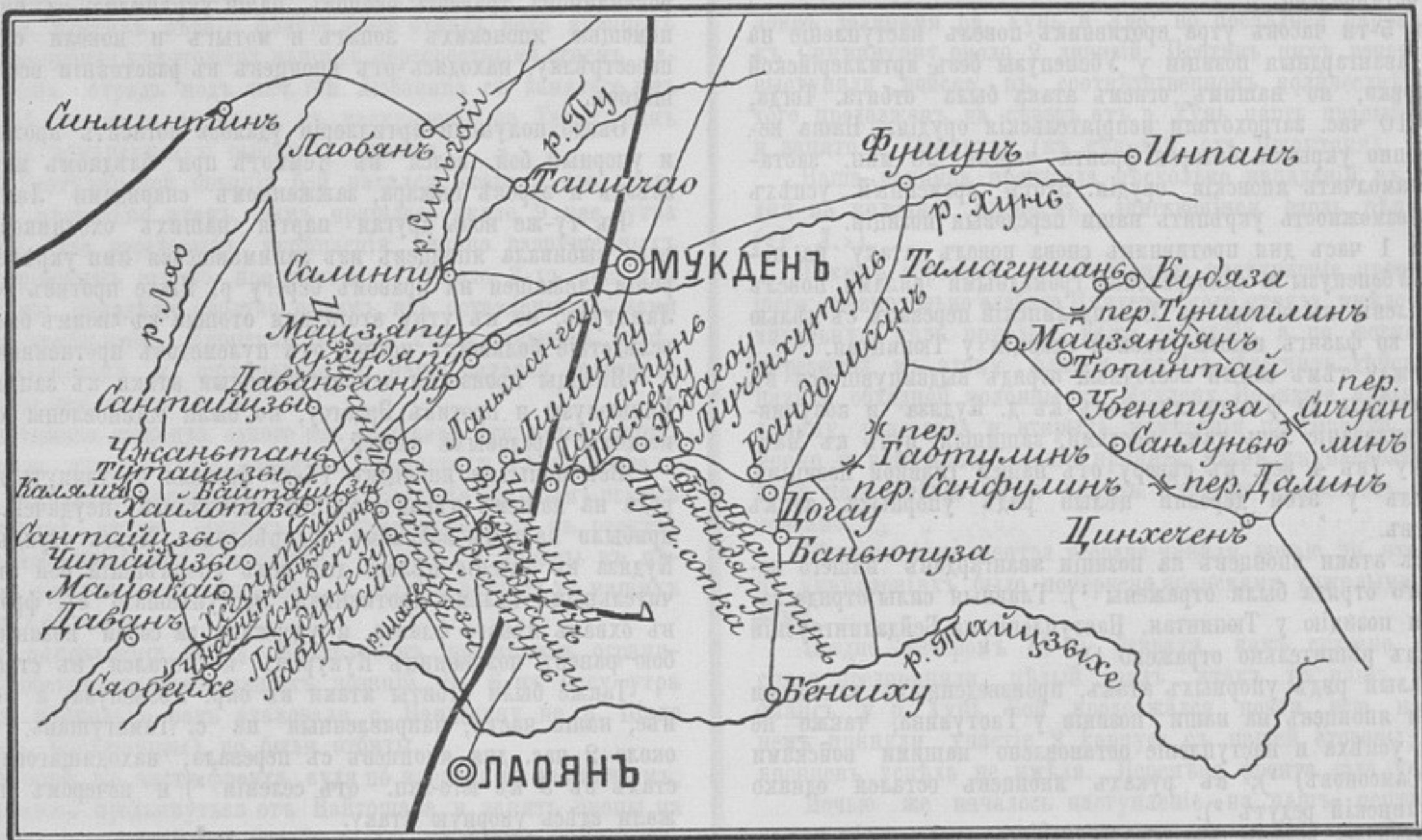
Схема района военныхъ дѣйствій съ 13-го по 20-е февраля.

Наступленіе яп. противъ позицій на перевалахъ Уан-фу-линъ и Кау-ту-линъ (Гаотулинъ) велось подъ прикрытіемъ сильнаго артиллерійскаго огня, съ обходомъ лѣваго фланга этого участка. Для противодѣйствія обходу была выдвинута колон-