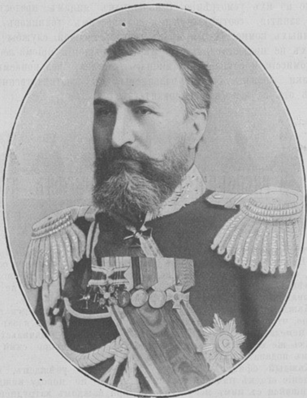
Главный редакторъ журнала «Военный Сборникъ» и газеты «Русскій Инвалидъ», генеральнаго штаба генераль-маіоръ