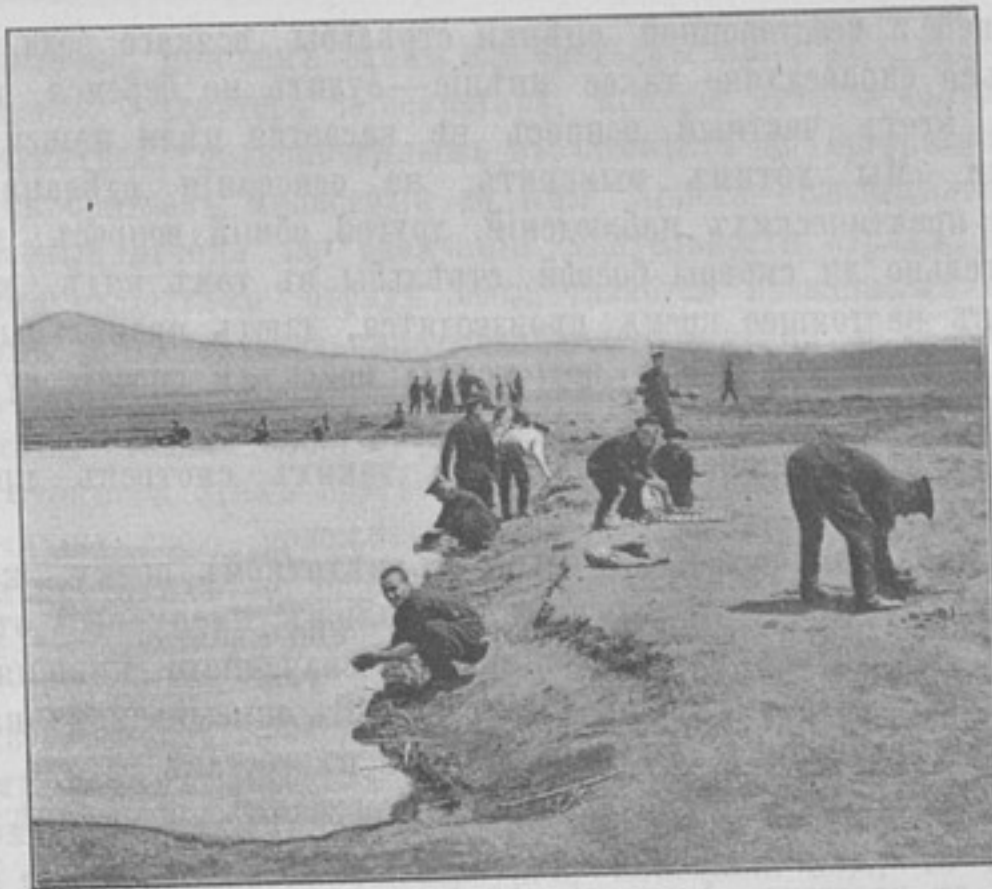
Ташичао. На биванѣ моютъ бѣлье.

къ денежному ящику караульный начальникъ, согласно ст. 180 уст. гарниз. службы, обязанъ исполнить. Въ виду этого возраженія долгомъ считаю дать болѣе подробныя объясненія.