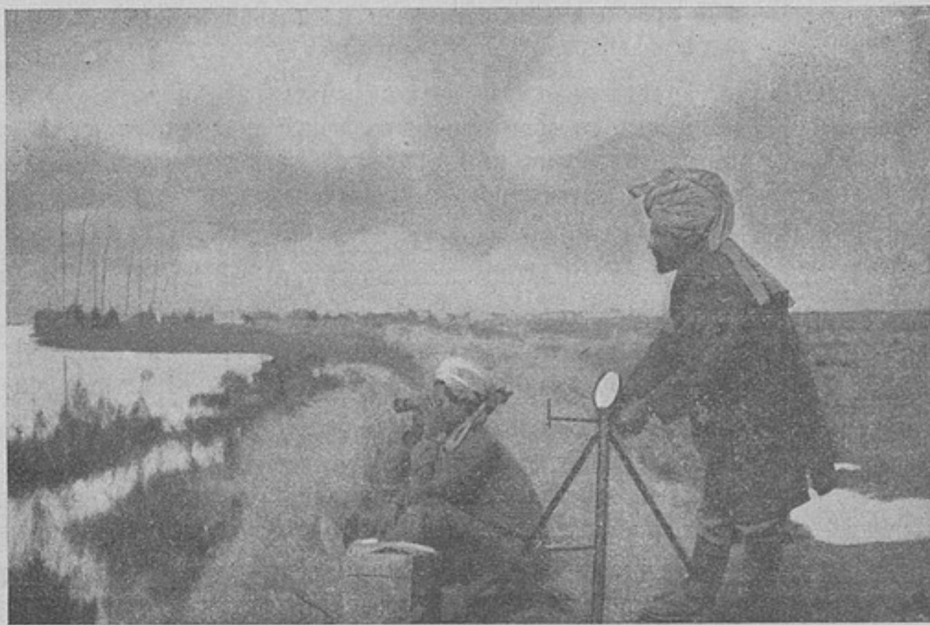
Гелиографистъ индійскихъ войскъ передаетъ сигналъ на противоположный берегъ Тигра.

Портовый городъ съ стотысячнымъ населеніемъ, имѣвшій огромное торговое значеніе на Дунаѣ, съ занятіемъ непріателемъ Браилова и праваго берега Дуная значительно опустѣлъ. Люди со средствами выѣхали частью въ Яссы и частью въ Россію. Привозъ товаровъ прекратился, и торговля, а вмѣстѣ съ тѣмъ жизнь, въ немъ уже не идетъ попрежнему. Остатки товаровъ по двойнымъ цѣнамъ раскупаются