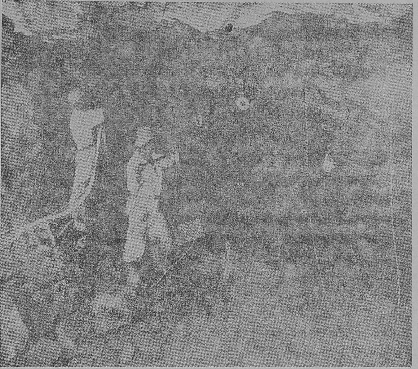
தாமிரச் சுரங்கத்தில் ஒரு காட்சி