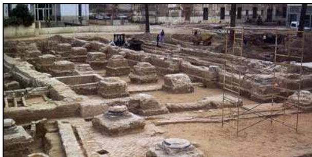
Vista de la Iglesia del antiguo Hospital General