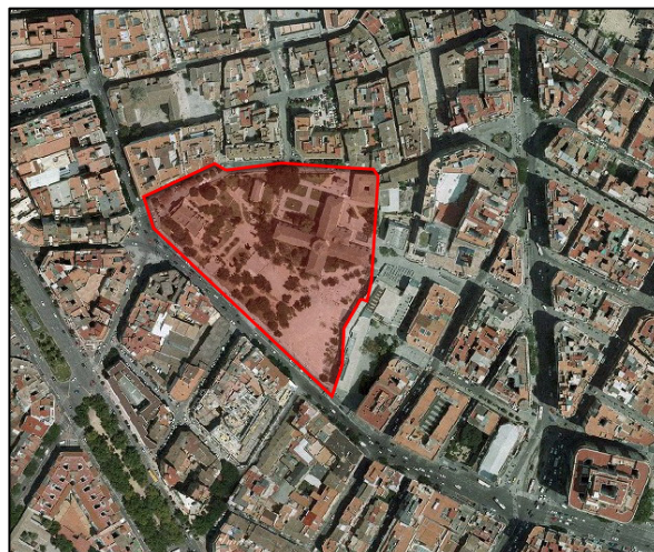
Foto aérea 2008 SIGESPA con ámbito arqueológico propuesto

Coordenadas UTM: X = 725.295,96 Y = 4.372.454,03 (Ver anexo parcelas catastrales) CART. CATASTRAL: 401-21-III / 423-1-I SUPERFICIE: 21.943,29 M2