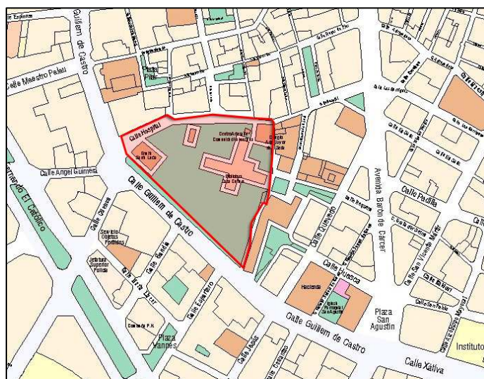
Planeamiento vigente SIGESPA con ámbito arqueológico propuesto