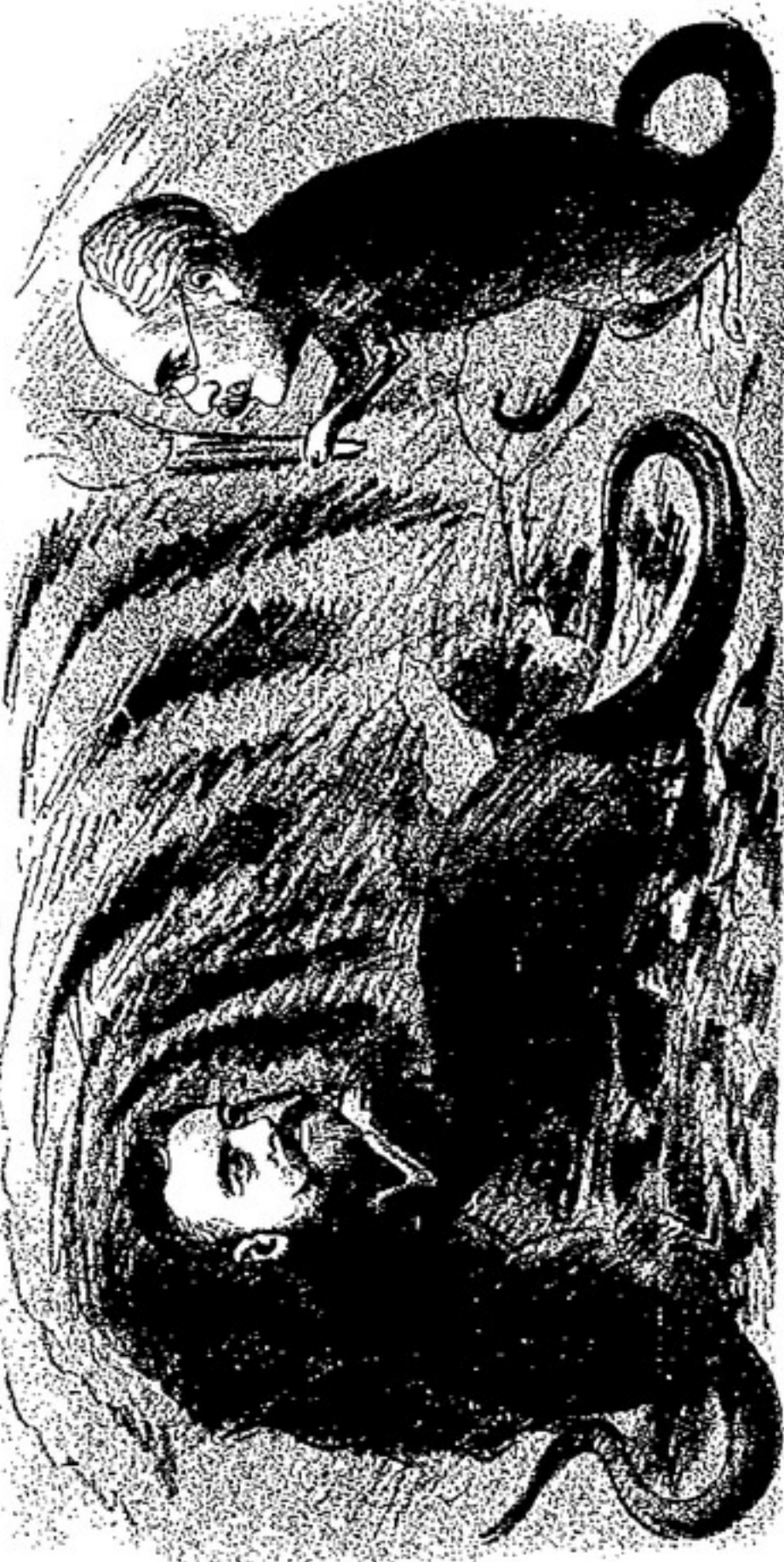
DEMARIÁ. — Yo soy compañero. Te no voy a dárselo que pesonar para dápat al queso.