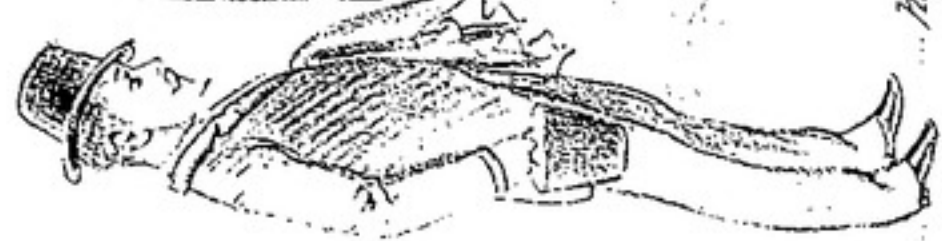
Perplejo... hey de que.

¡POLI-CIANA! GDEON LA IRA EMPESTE COTIZASISTO MANJON VILVISA 24 ONRUBIA OPERA CASA 28 Jovuz de CLARLETTE FOLLECOS