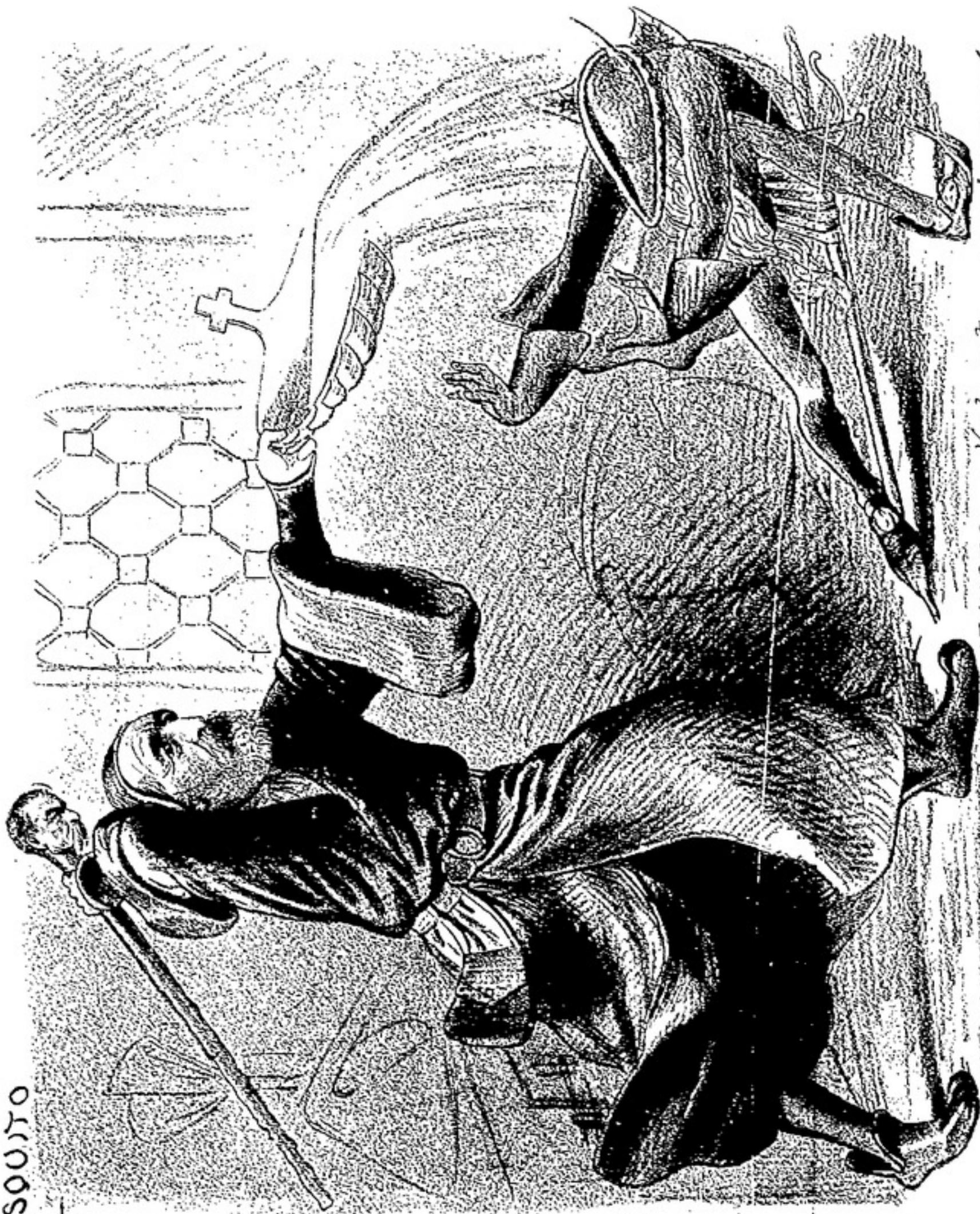
FAUSTO. — ¡Vade retro... mazaingnero!