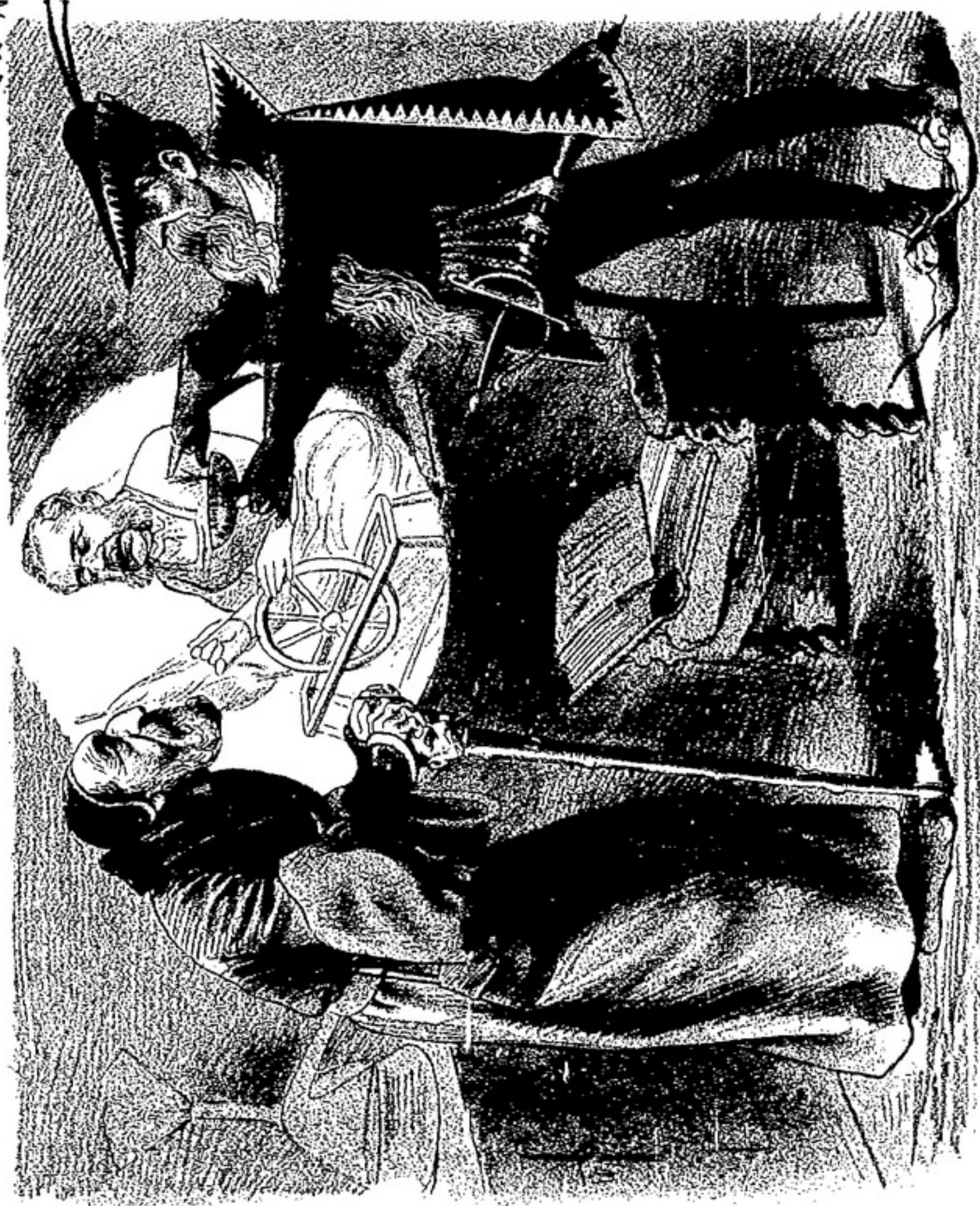
MEFISTO. — Si tragas esto, te repureneces.