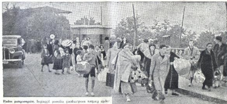
Pados pangoengsén. Ingkanggi poenika gambaripoen tetjag ejaleté etri poenapadéné laré ing kity Iran, nagari Sepanjil, malika sami bidal ngrengsi panggeoran sanés djalaran ingrikoe kawartosaken badé kedjatangan mengsah.

Serat-serat kabah ing nagari Djerman sami mratelakaken bilih sesorah wagoe adamel wirangipoen para kawoela nagari Djerman lan adamel wirangipoen Hitler, sarta nagari Frankrijik wadjih soela ketrangan ing bah wagoe. Nagari Djerman ngadjeng-adjeng Pamarintah nagari Frankrijik poerona toemandang ing saestajipoen ing antjaisipoen pokalipoen Thorez lan tjang sanes-sanesipoen ingkang sami adamel wirangipoen nagari Djerman wagoe.