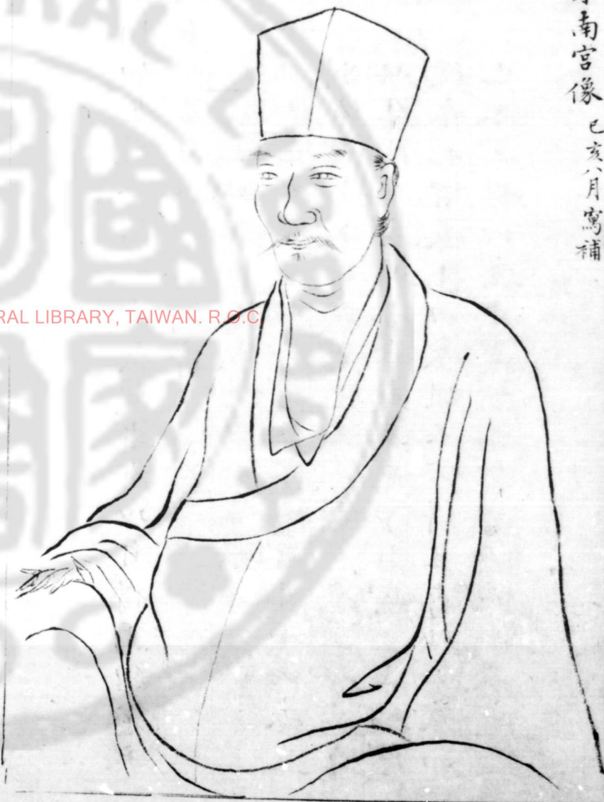
米南宮像 己亥八月寫補