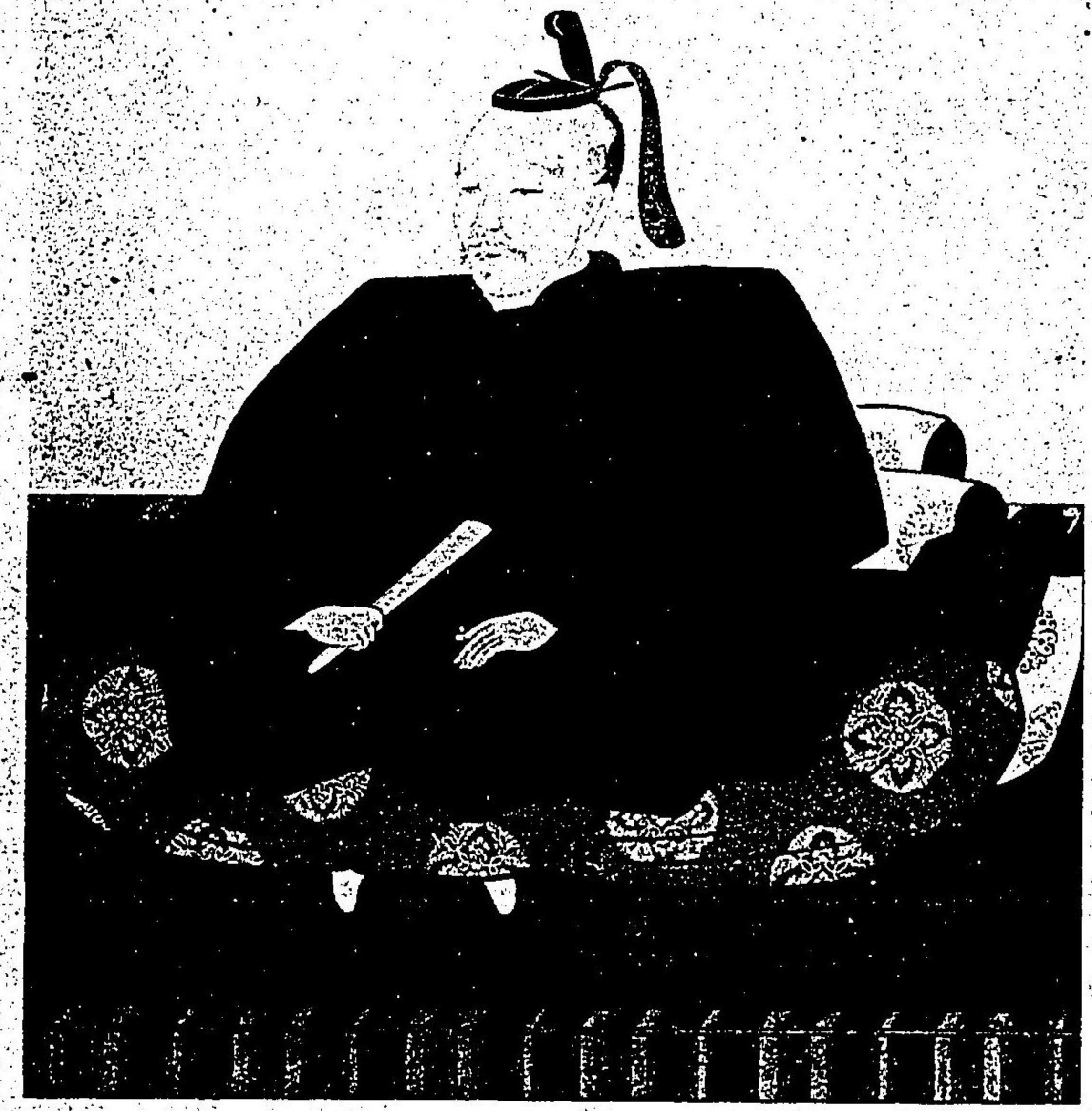
前田利家畫像 射水郡氷見町光禪寺所藏