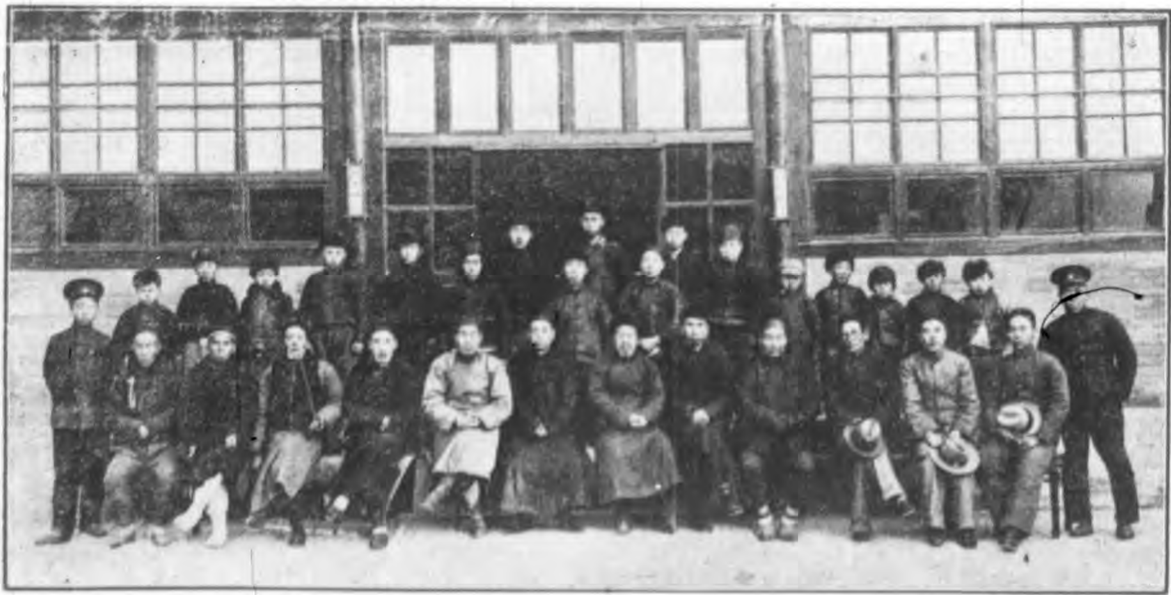
本館農建區第一民校第一期畢業留影