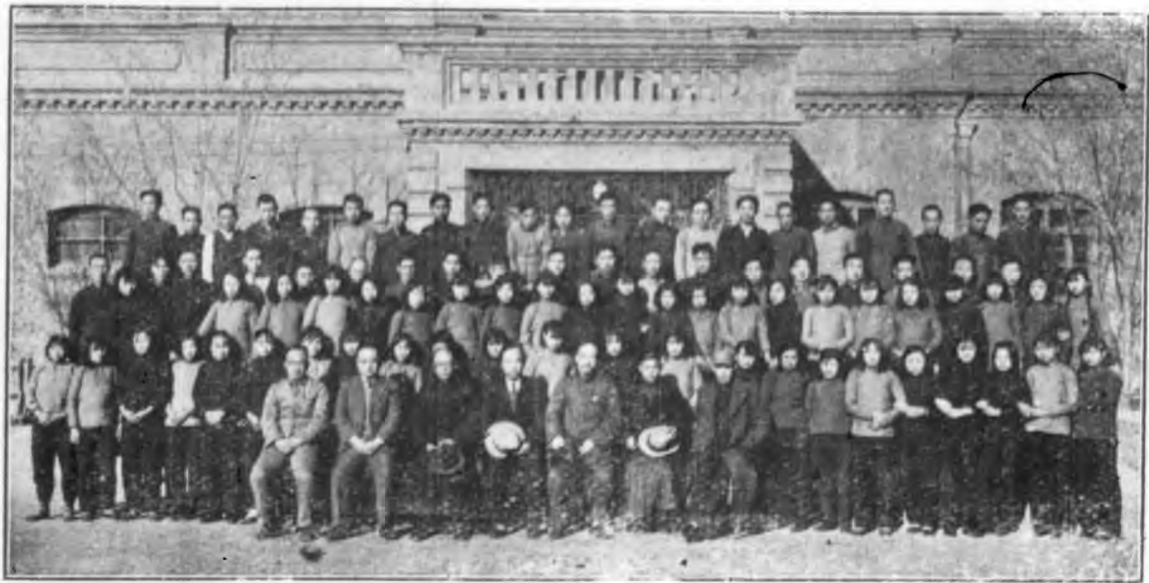
本館創設之晉生勞工學校成立紀念