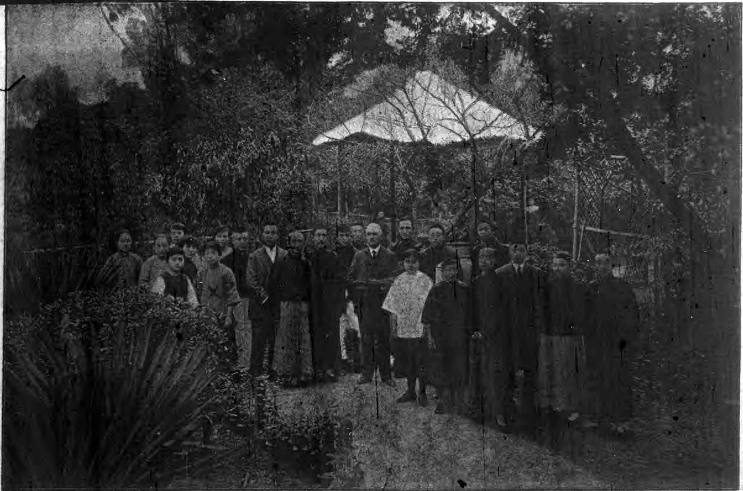
士女雲慧毛之故身水落爲者記爲×有上衣