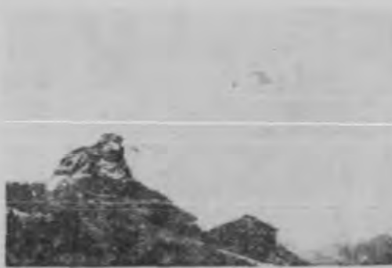
雞 公 頭

右北而下，道旁石壁下有井，其水澄澈，西人為木門以隔之，恐其濁也。甬山坡而上，仰視一石峰壁立千仞，高入雲霄者，即俗所謂雞公頭也。峯前有小廟一，為青石砌成，破壞不堪，似無香火，峰巒有平石一方，可坐憩，極目四顧，萬里無所蔽，俯瞰衆山，如龍騰虎踞，旗幟布列之狀，一覽無餘。