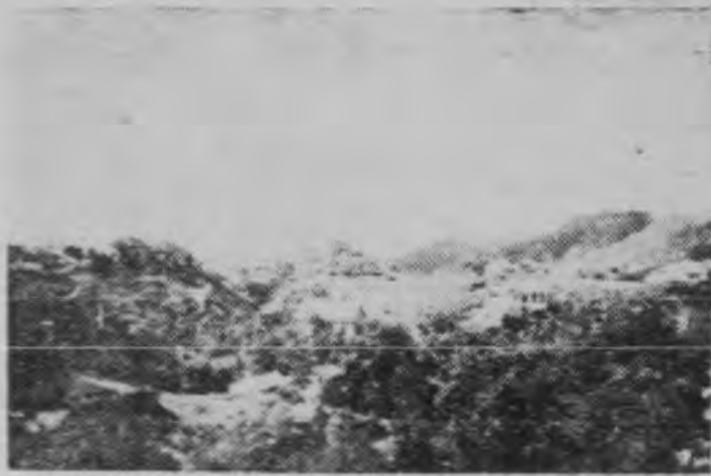
新 家 大 樓

七、風景與古蹟：廬山房屋散佈，森林鬱鬱，雞公山房屋整齊，全爲森林掩蔽，廬山古蹟多，雞公山古蹟較少。