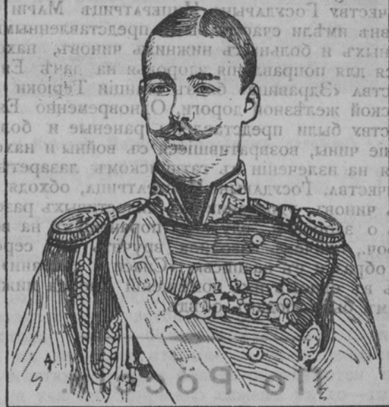
ЕГО ИМПЕРАТОРСКОЕ ВИСОЧЕСТВО ВЕЛИКІЙ КНЯЗЬ МИХАИЛЬ АЛЕКСАНДРОВИЧЪ.

Униженіе это не въ томъ, что намъ предстоятъ расходы на «покупку мира», русский человекъ не привыкъ соизмѣрять честь и безчестье съ деньгами — заплатить бы еще куда ни шло, а вотъ кланяться японцу, «ломать передъ нимъ шапку» не въ примѣръ тяжело. Положеніе побѣжденныхъ