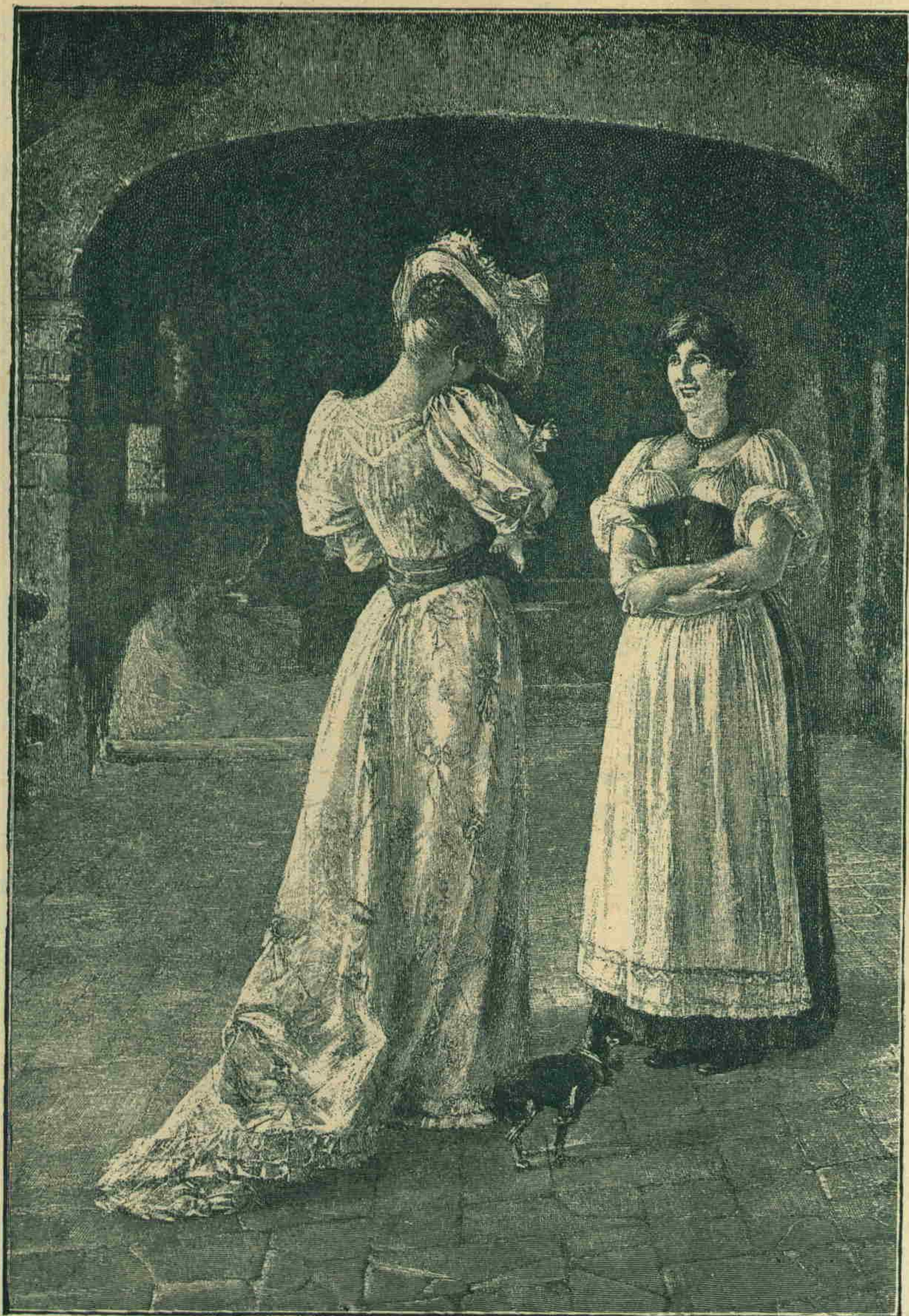
[ بر لوحه ]

بونی هیچ برعداب درون طویمدهن ، قلبنک برتلی اوینامه دن دوشونمش ایدی . اودن چیققدن صکره مکتبه دکل موقفلردن برینه کیتدی ، تیور یول موقفلری اونک نظرنده دنیانک اوبر اوچنه کیدن یوللرک آغزیدی ، لاعلی التعمین بونلردن برینه کیتمک مقصدینی تأمینه کافیدی . او کون موقفده فوق العاده بر غلبه لوق واردی ؛ کوزینه بو یوک اعلاننامه لر ایلیشیدی ، ابری حرفلرله اطرافنه خلقی طویلا یان بوکا غدلری اوقودی : سن قلو پناری ... بواسمی ، بو پناری پک چوق ایشیتمش ایدی ، عجیبا اورایه کیتسه ؛ درحال قرار ویردی ؛ قطار حرکت ایدنجه قاینده اوافق بر قورقو واردی ، صکره کندیسنی غلبه لکک اینجده ، پنایر یرنده کورونجه بیوک بر بوکدن قورتمشجه . سنه قوشمق آرزوسی ویرن بر خفت طویدی . بوراده قورولان تخته دکانلرک اوکنده توقف ایدرک ، بر آئی اویناتان چنکانه قیزینک تپسیسنه پاره آتدرق ، اوتده تخته آنلره بینرک — هر طرفدن هر بری بر باشقه هوا ایله قارشیلار شوق پنایرک اوستنده بر طاق طیندار قوران بورولرک ، فلاوتالرک ،