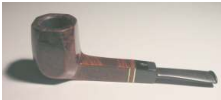
Abbildung 4 - Tabakspfeife aus Holz: panelisierte Billard-Standpfeife mit Sattelmundstück, Hersteller: Savinelli, Italien

Die Tabakspfeife ist ein Rauchgerät, in dem in einer Brennkammer Tabak verbrannt und durch ein Mundstück in den Mund aufgenommen wird. Die Tabakspfeife ist fast so lange bekannt wie der Tabak selbst und Bestandteil vieler Nord- und Südamerikanischer Kulturen. Das Pfeifenrauchen war neben dem Tabakschnupfen bis zum Ende des 19. Jahrhunderts die verbreitetste Art, Tabak zu konsumieren. Mittlerweile sind Tabakspfeifen und Pfeifenraucher durch die Verbreitung von Zigaretten und Zigarren in den Hintergrund gerückt.