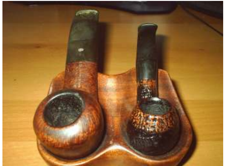
Abbildung 10 - Tabakspfeifen aus Bruyère

Die Pfeifenform hat kaum Einfluss auf den Geschmack des Tabaks. Wenn dieser jedoch durch einen langen Holm und ein langes Mundstück gezogen wird, zum Beispiel bei Lesepfeifen, die ein langes Mundstück von fünfzehn bis