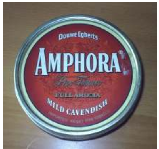
Abbildung 19 - Tabakdose

Nach dem Rauchen sollte die Pfeife zum Abkühlen weggelegt werden. Nach etwa ein bis zwei Stunden sollte die Asche ausgeschüttet und die Pfeife sowie Mundstück mit Pfeifenreinigern gründlich gereinigt und der benutzte Filter weggeworfen werden. Eine Tabakspfeife sollte nach dem Rauchen mindestens 24 Stunden nicht geraucht werden, damit die vom Holz aufgenommene Tabakflüssigkeit verdunsten kann.