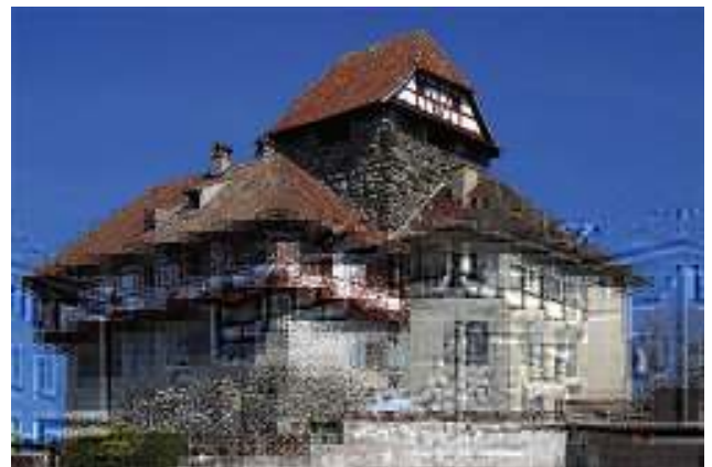
Abbildung 3 - Das Schloss Frauenfeld