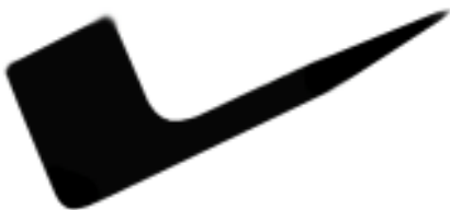
Abbildung 8 - Schema einer Billard-Pfeife

Pfeifen können von Maschinen hergestellt oder von Hand gefertigt werden, was sich im Verkaufspreis niederschlägt. Handgemachte Pfeifen lassen sich meist erst ab 100 Euro aufwärts finden. Maschinell gefertigte, sowie benutzte oder restaurierte Pfeifen gibt es auf dem Markt bereits für Preise ab 10 Euro. Es gibt weiterhin Preisunterschiede zwischen den Pfeifenherstellern. "Markenpfeifen", wie zum Beispiel von bekannten Serienherstellern wie Dunhill, Stanwell oder Vauen können mehrere hundert Euro kosten. Sammlerpfeifen (signierte Jahres- und Weihnachtspfeifen), Einzelstücke (Freehandpfeifen) und Antiquitätenstücke erreichen oft einen vierstelligen Preis. Der Preis richtet sich nach dem Renommee des Herstellers und insbesondere nach der verwendeten Holzqualität.