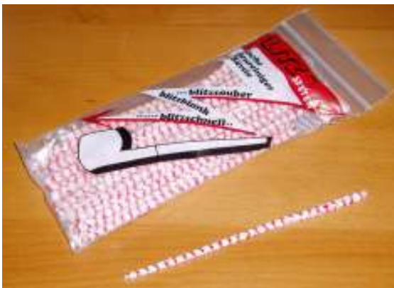
Abbildung 20 - Pfeifenreiniger und Packung

Das Tabakrauchen ist unbestritten gesundheitsgefährdend, aber Pfeifenrauchen ist vermutlich die am wenigsten risikobehaftete Variante. Da man den Rauch nicht in die Lunge aufnimmt, oder meist wegen der Stärke und Dichte nicht aufnehmen kann, sind die typischen Probleme des Zigarettenrauchens, nämlich Bronchitis und Lungen- oder Kehlkopfkrebs, nicht sehr häufig zu erwarten. Jedoch kann durch passives Einatmen von Pfeifenrauch eine Belastung der Lungen eintreten. Die Gefahr des Rachenkrebs oder des Mundkrebs sind jedoch nicht zu unterschätzen, da der Rauch für mehrere Sekunden im Mundraum verbleibt, bevor er wieder herausgeblasen wird. (Paffen).