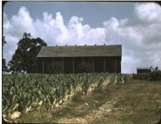
Abbildung 16 - Burley-Tabakfeld, 1940

Der ältere Flake Cut ist ein stark zusammengepresster Tabak, der in der Handfläche in die gewünschte Feinheit zerrieben und zerdrückt wird. In der Herstellung wird der Tabakkuchen vor dem Pressen ohne weitere Aufbereitung in zwei Schneidvorgängen erst in Riegel, dann in rechteckige dünne Scheiben geschnitten und schließlich in einer luftdichten, rechteckigen Dose verpackt.