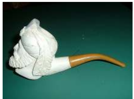
Abbildung 12 - Meerschaumpfeife

Die Meerschaumpfeife wurde in Europa erst im 18. Jahrhundert bekannt, aller Wahrscheinlichkeit nach war sie aber in der Türkei, dem Land, in dem dieses Material hauptsächlich vorkommt, bereits im 17. Jahrhundert in Gebrauch. Das Mineral (Meerschaum), das ursprünglich Lüle-Stein hiess, ist ein Sepiolith, in der Chemie Magnesiumsilikat genannt, verwandt dem Magnesit (Magnesiumkarbonat).