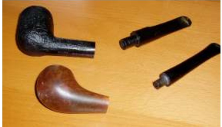
Abbildung 7 - 2 Pfeifen, mit Filter und filterlos

Eine Tabakspfeife besteht meist aus einer Kammer zur Verbrennung des Tabaks und einem Holm, der vom Pfeifenkopf aus im Mundstück endet. Das Mundstück wurde früher aus Naturkautschuk (Ebonit) gefertigt, aber ist heutzutage meist aus hitzebeständigem synthetischen Kunststoff (Acryl) hergestellt und wird in den Holm eingesteckt. Ebonitmundstücke haben den Vorteil, dass ihr Biss weicher ist. Ihr entscheidende Nachteil ist aber, dass sie sich im Laufe der Zeit durch Oxidation grünlich verfärben und dann unangenehm schmecken, daher müssen sie oft gereinigt und poliert werden. Der Pfeifenholm ist oft so gearbeitet, dass zwischen Kopf und Holm ein 9-Millimeter-Aktivkohlefilter eingesetzt werden kann, dieses System ist insbesondere in Deutschland vorherrschend. Doch auch filterlose Pfeifen oder Pfeifen mit anderen Filterformaten sind erhältlich und in vielen Gebieten ist das jeweilige das einzige erhältliche Pfeifenformat.