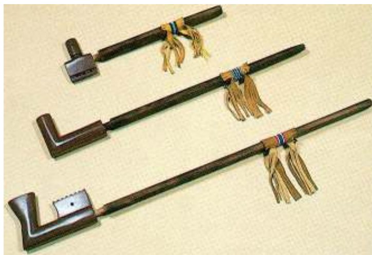
Abbildung 5 - Skizzen von Indianerpfeifen

Die Friedenspfeife (Lakota: Chanunpa Wakan ) ist noch heute ein bekanntes und gebräuchliches Symbol für eine Streitschlichtung. Die Friedenspfeife wurde früher "Heilige Pfeife" genannt und diente mehreren indianischen Ethnien, wie zum Beispiel den Lakota-Indianern, zum Gebet. Die "Heilige Pfeife" wurde auch zu Friedensabschlüssen, zur "Besiegelung" von Freundschaften und während des Abschlusses von Verhandlungen, Geschäften und Verträgen geraucht. Daher prägten die weißen Einsiedler, die in diesen Zusammenhängen mit dem Ritual in Berührung kamen, den Begriff Friedenspfeife .