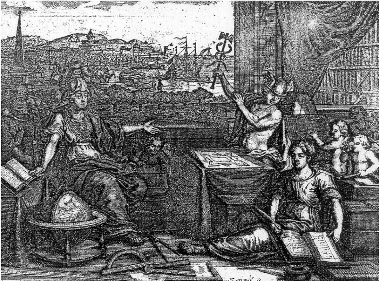
Abbildung 24 - Grafik zu Beginn des Abschnitts zum Buchstaben "A" im "Zedler" (1732)

Das Grosse vollständige Universallexikon aller Wissenschaften und Künste , kurz nach dem Verleger Zedlersches Lexikon genannt, ist die erste deutschsprachige Enzyklopädie und gilt als das größte bis dahin gedruckte Universallexikon des Abendlandes; es war zunächst auf etwa zwölf und später auf 24 Bände angelegt, wuchs dann jedoch zu einem Umfang von 64 Bänden und vier Supplementen mit insgesamt rund 750.000 Artikeln auf 62.571 Seiten; von den ursprünglich acht geplanten Supplementbänden realisierte Carl Günther Ludovici nur vier (erschieden zwischen 1732 und 1754). Der "Zedler" wurde in der Waisenhausdruckerei in Halle gedruckt, die zu den Halleschen Stiftungen von August Hermann Francke gehörte (vergleiche http://www.repositorium.net/zedleriana/zherstwaisen.htm ). Ein Neudruck des "Zedler" wurde zuletzt zwischen 1961 und 1964 in Graz aufgelegt.