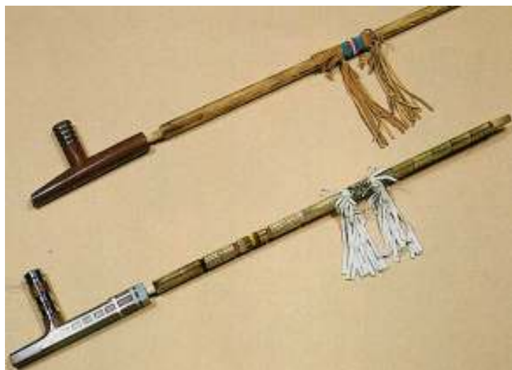
Abbildung 6 - Skizzen von Pfeifen, deren Aussehen die nordamerikanischen Siedler von Indianern übernahmen

In der Indianerkultur und deren Glaube hat jeder Teil einer Tabakspfeife eine spezielle Bedeutung. Der Pfeifenkopf, in der Regel aus Catlinitstein gehauen und geschnitzt, steht für "Mutter Erde". Der Pfeifenstiel steht für das menschliche Ich und die Herkunft des Menschen. Das Pfeifenrohr wird aus dem Holz der Weißesche hergestellt und stellt das Pflanzenreich dar.