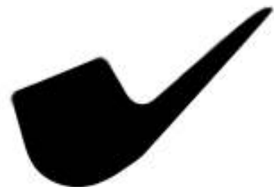
Abbildung 9 - Schema einer Bent-Pfeife

Pfeifen der unteren Preiskategorien haben meist kaum eine erkennbare Maserung und sind zudem dunkel lackiert. Außer der glatten Oberfläche sind auch bearbeitete Oberflächen (rustiziert oder sandgestrahlt) bekannt. Zur Verzierung können an der Pfeife Applikationen aus Acryl, Edelhölzern, Edelmetallen wie Messing, Silber oder Gold angebracht sein.