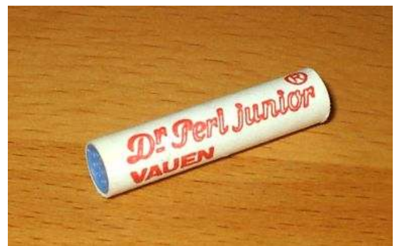
Abbildung 17 - Pfeifenfilter