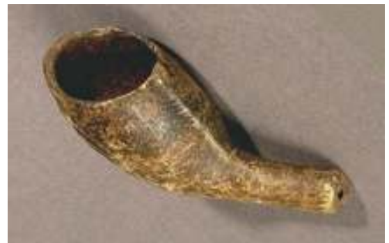
Abbildung 11 - Fund einer Tonpfeife aus 1770

Die ersten Tabakspfeifen wurden aus Ton gefertigt. Durch dieses beständige Material und die regional unterschiedlichen Formen und Herstellerstempeln sind Tabakspfeifen zu wertvollen Datierungshilfen für Archäologen geworden. Auch Sammler begeistern sich für diese Art von Pfeifen. Tonpfeifen wurden im 19. Jahrhundert mehr und mehr durch Holzpfeifen verdrängt, die nicht so zerbrechlich und handlicher waren.