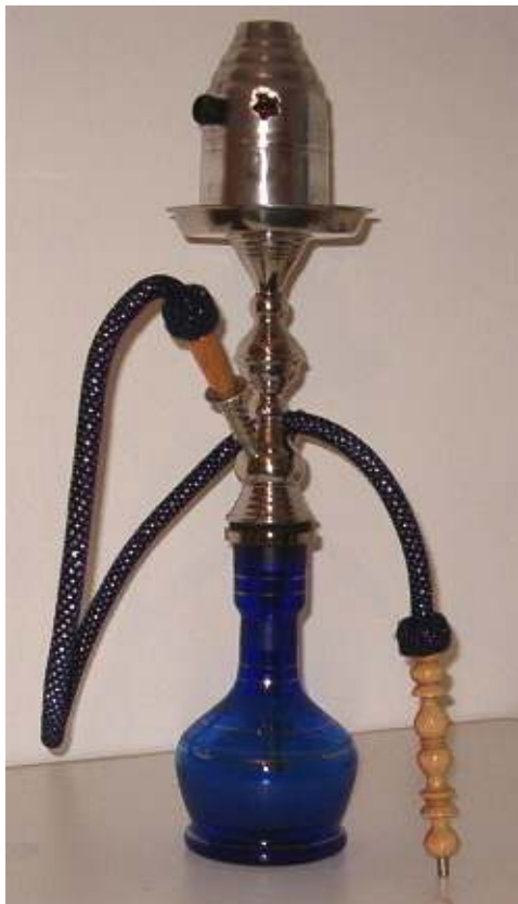
Abbildung 14 - Glaspfeife (Kunstobjekt)