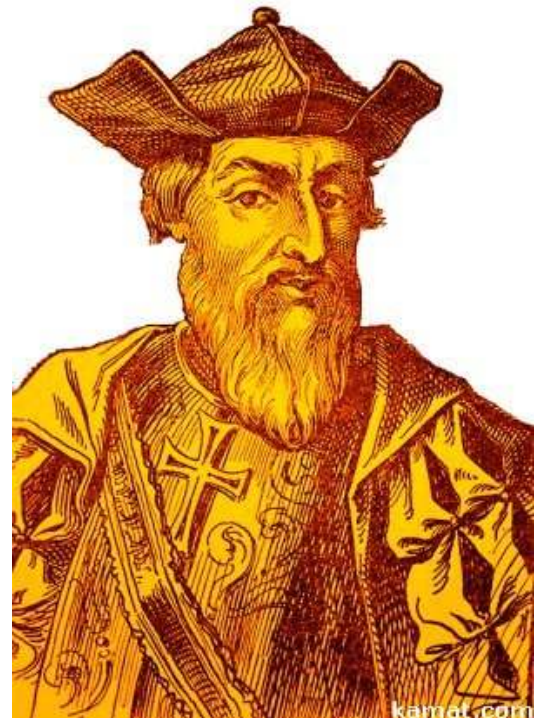
Abbildung 1 - Vasco da Gama

Das Museu Naval (Seefahrtsmuseum) in Faro stellt Modelle historisch bedeutsamer Schiffe aus, darunter eines der Nau São Gabriel , Vasco da Gamas Flaggschiff.