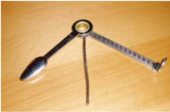
Abbildung 18 - Einfaches Pfeifenwerkzeug mit Stopfer, Schaufel und Draht (zum Reinigen)

für ausgetrockneten Tabak, der erst wieder befeuchtet werden sollte. Den richtigen Feuchtegrad hat man mit der Zeit im Gefühl oder man nutzt ein Hygrometer. Am besten tut man dies durch einen Tabakbefeuchter (oder eine feuchte offeneporige Tonscherbe), den man in Tabakhandlungen kaufen kann, oder durch eine Apfelscheibe, die über Nacht in den Tabak gelegt wird. Die Apfelscheibe kann allerdings zur Schimmelbildung beim Tabak führen, der dann verdorben ist.