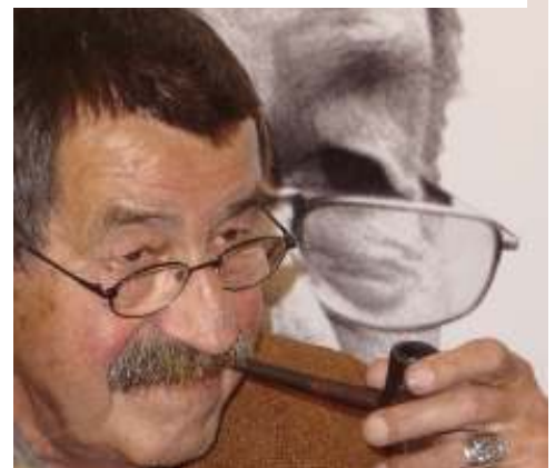
Abbildung 22 - Günter Grass mit Pfeife