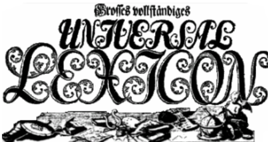
Abbildung 23 - Titelschriftzug von Zedlers Universal-Lexikon

Das Grosse vollständige Universallexikon aller Wissenschaften und Künste ist eine Enzyklopädie von Johann Heinrich Zedler (1706-1751).