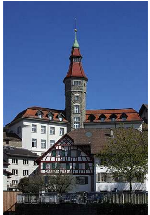
Abbildung 2 - Das Rathaus von Frauenfeld