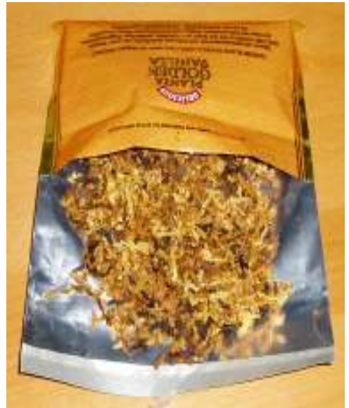
Abbildung 15 - Frischer Pfeifentabak als rauchfertige Mixture

Eine früher sehr verbreitete Tabakschnittart ist der Curly Cut . Als Curly Cut wird ein Tabak bezeichnet, dessen Mischung aus hellen und dunklen Blättern besteht, welche zu einem dünnen Strang gedreht und in kleine runde Scheiben geschnitten werden. Diese Scheiben können entweder in der Handfläche zerrieben werden, bevor sie geraucht werden oder ganz in die Pfeife gestopft werden.