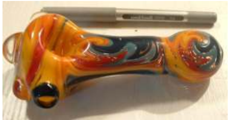
Abbildung 13 - Glaspfeife (Kunstobjekt)

Handgeblasene Glaspfeifen sind eine der meistgeblasenen und eine der aufwändigsten zu blasenden Werkstücke. Sie werden auch Bong genannt und insbesondere zum Rauchen von Cannabis genutzt. Glaspfeifen beeinträchtigen durch ihre Geschmacks- und Geruchsneutralität den Rauch in keiner Weise. Jedoch kann das Glas im Gegensatz zu Holz, Ton oder Meerschaum das beim Rauchen entstehende Kondenswasser nicht aufnehmen, so dass dieses den Tabak oder das Cannabis durchfeuchtet und das Kondensat ( Sud ) in den Mund gelangen kann.