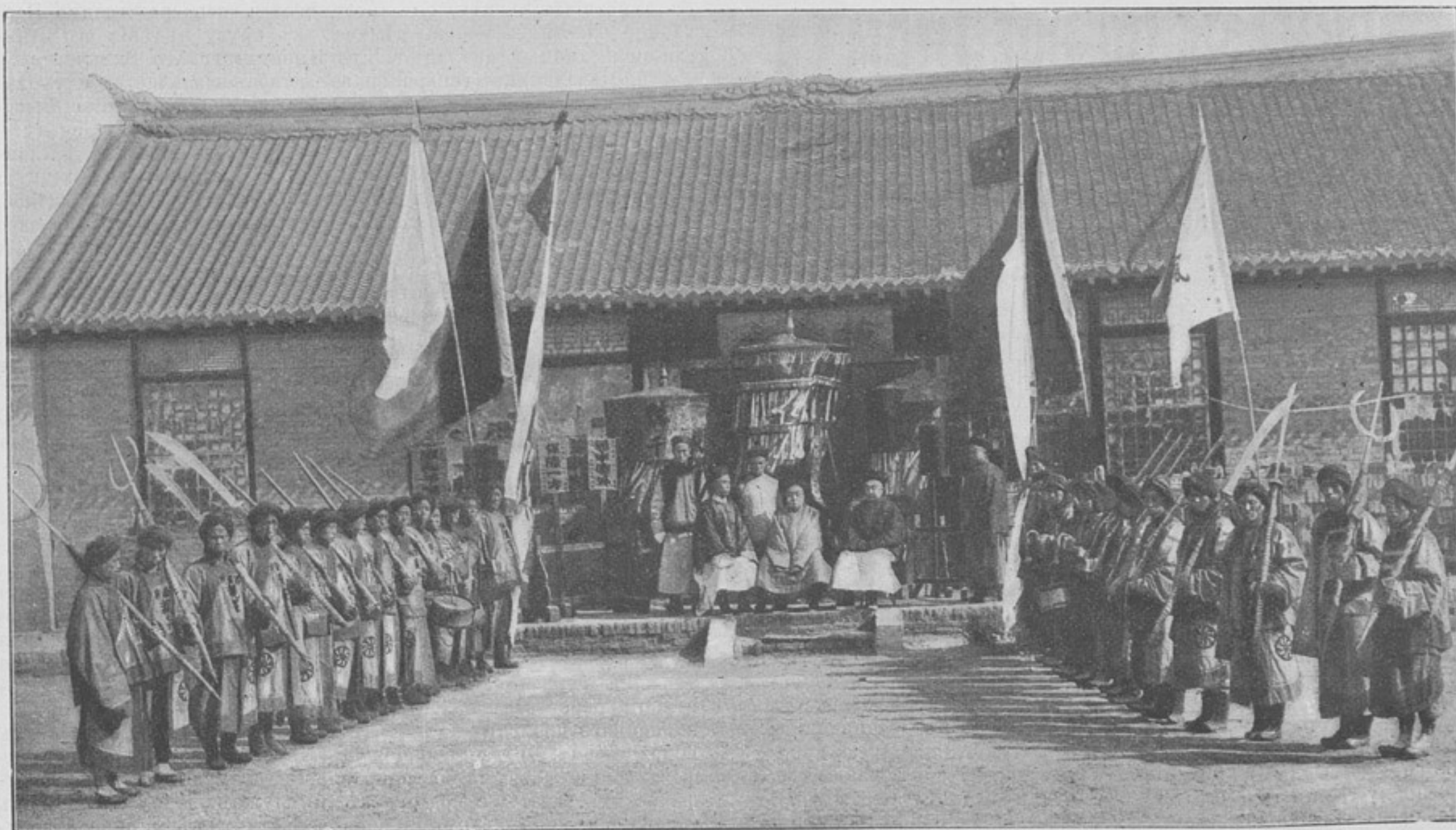
Дзянь-дзюнь и его свита.

Нынѣ, призывая васъ въ качествѣ Моего ближайшаго помощника на постъ председателя Совѣта государственной обороны, Я съ чувствомъ глубокой благодарности вспоминаю