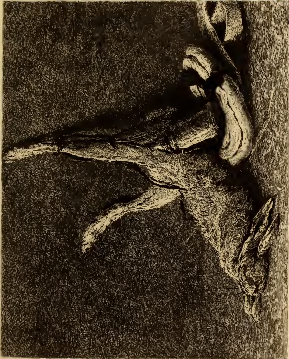
Lepus Montanus 2 sp. Chardun