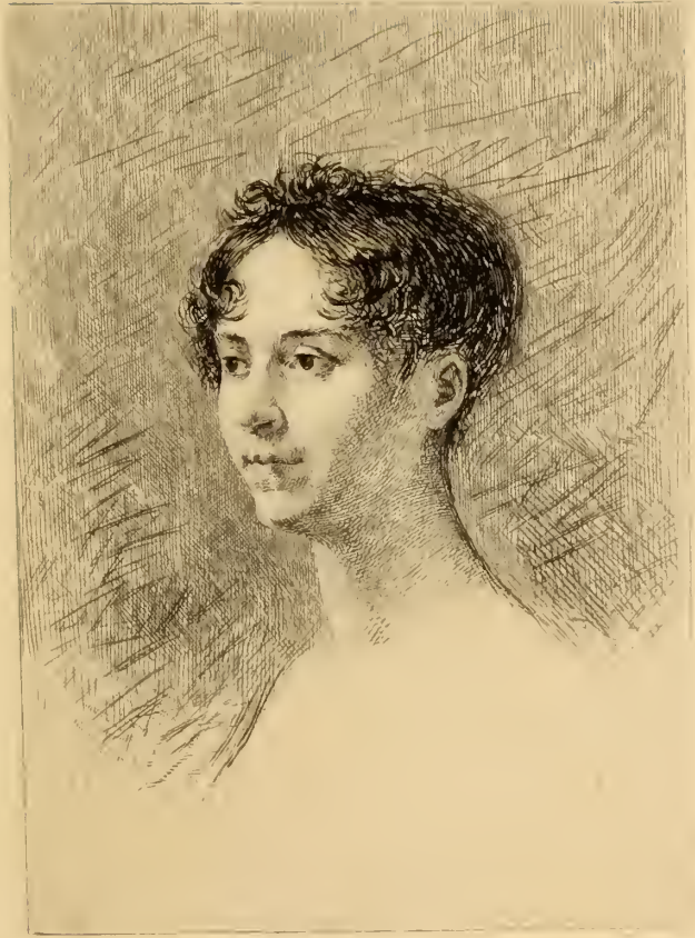
Young man - 1850