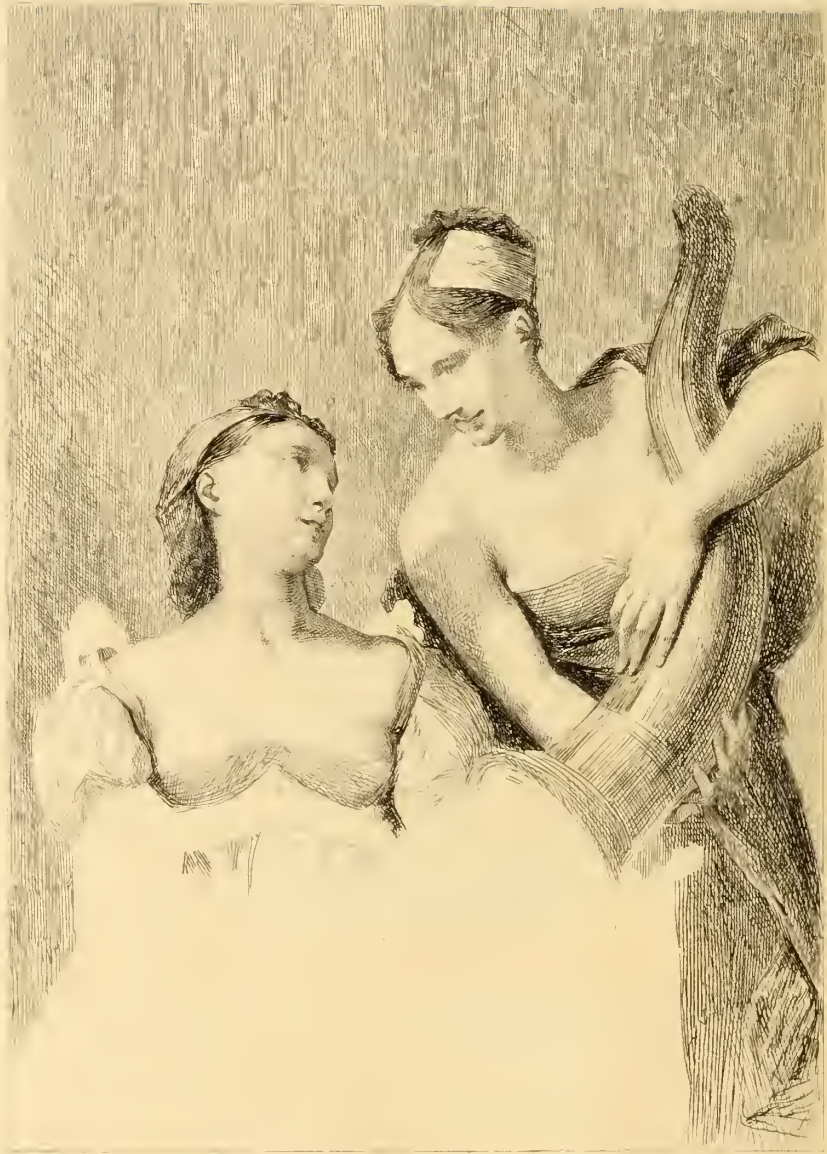
W. Laing, d'après Paul bon