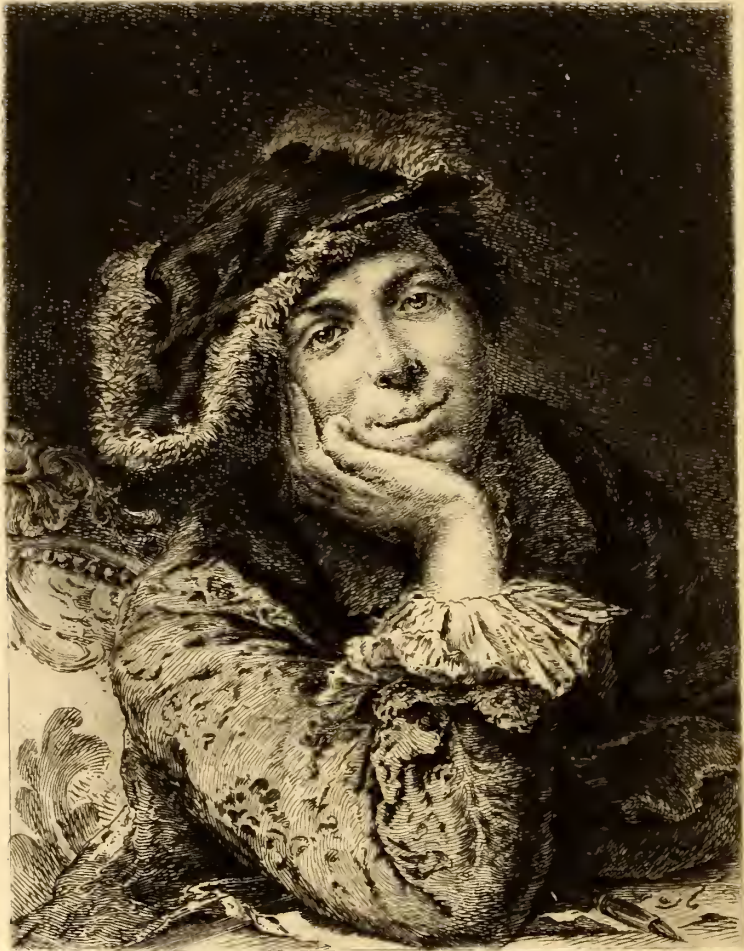
L. Monzes Day. Laroue