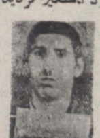
زینب تیم نادر برای ادامه تحصیلات خود بامریکایت

خروج آقای ظهر الاسلام ساعت ۷ و نیم بمذاظر ظهر روز گذشته با هوای یاسویی