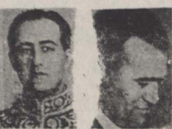
دولت آبادی مشر فاطمی اختیار کلیه جراید گذارده خواهد شد.

سخن روی انجمن نظارت مرکزی اعلام کرد: بهیچوجه اجازه دخالت در امر انتخابات به احزاب و دستجات مختلف داده نخواهد شد آگهی انتخابات که در یکی از جراید عصر منتشر شده بود مورد تکذیب انجمن قرار گرفت