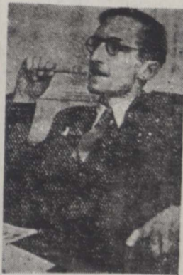
آقای استیونس سفیر کبیر انگلیس هنگامیکه برای دادن پاسخ به سوالات خبرنگاران فکرمی کند

این تصیبات در پایان کمیسیون با اطلاع سازمان ملل متحد خواهد رسید.