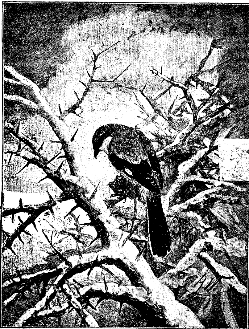
Iarna în pădure.

un bunic al lui, erau nebuni. Sora lui Kant, copiii lui Volta erau nebuni. — Vedem dar o legătură foarte strânsă între geniū și nebunie, un fel de înrudire, fără înse de a ne pute explica cum se face aceasta.