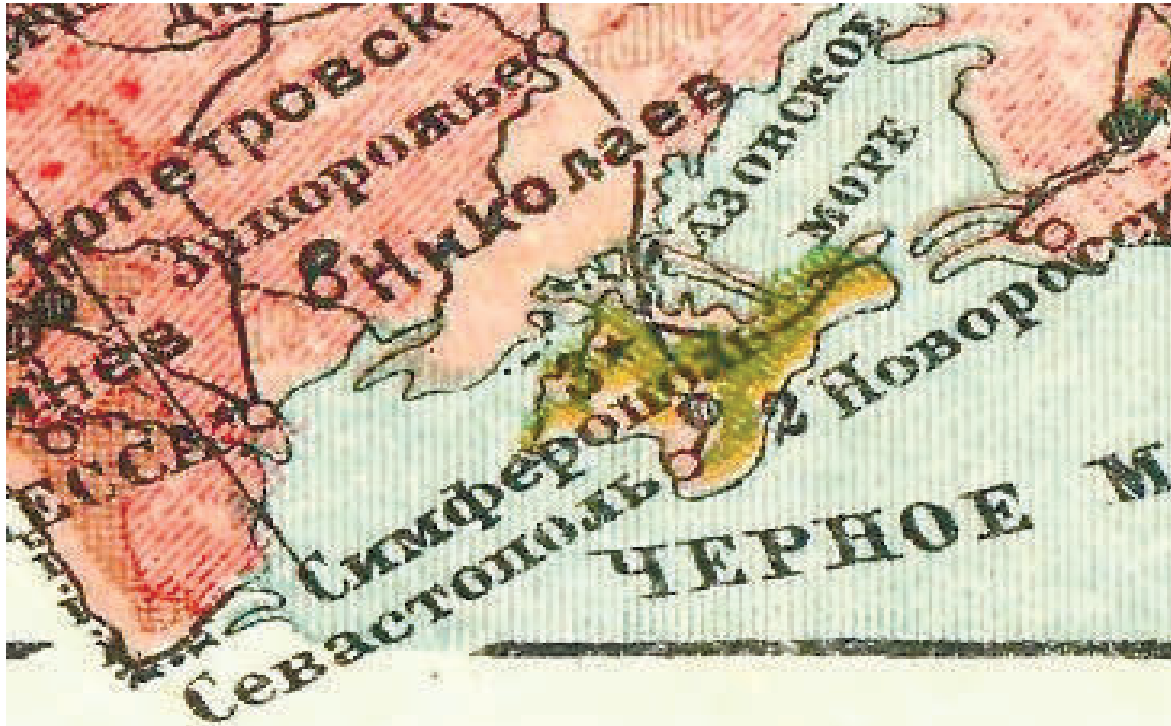
ФОТО з ВІКІПЕДІЇ

Така відповідь не відбивала дійсного ставлення всіх членів ЦК КП(б)У щодо цього питання. Пам'ятаючи діяльність Закордота, який розміщувався на території України і керував повстанською боротьбою більшовиків у Криму, керівники УСРР намагалися власноруч керувати цією територією. Протягом кінця 1920 – першої половини 1921 рр. український уряд активно втручався у процеси, що відбувалися в Криму. Москва, своєю чергою, теж вважала Крим власною територією, а тому надсилала на півострів свої вказівки (як і в Україну) і вимагала їх негайного виконання. Певний час питан-