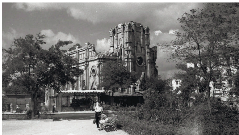
Руїни римо-католицького храму в Севастополі після Другої світової війни (орієнтовно 1950-ті рр.)

цього було розпущено «у зв'язку з відсутністю духівництва та непроведенням богослужінь».