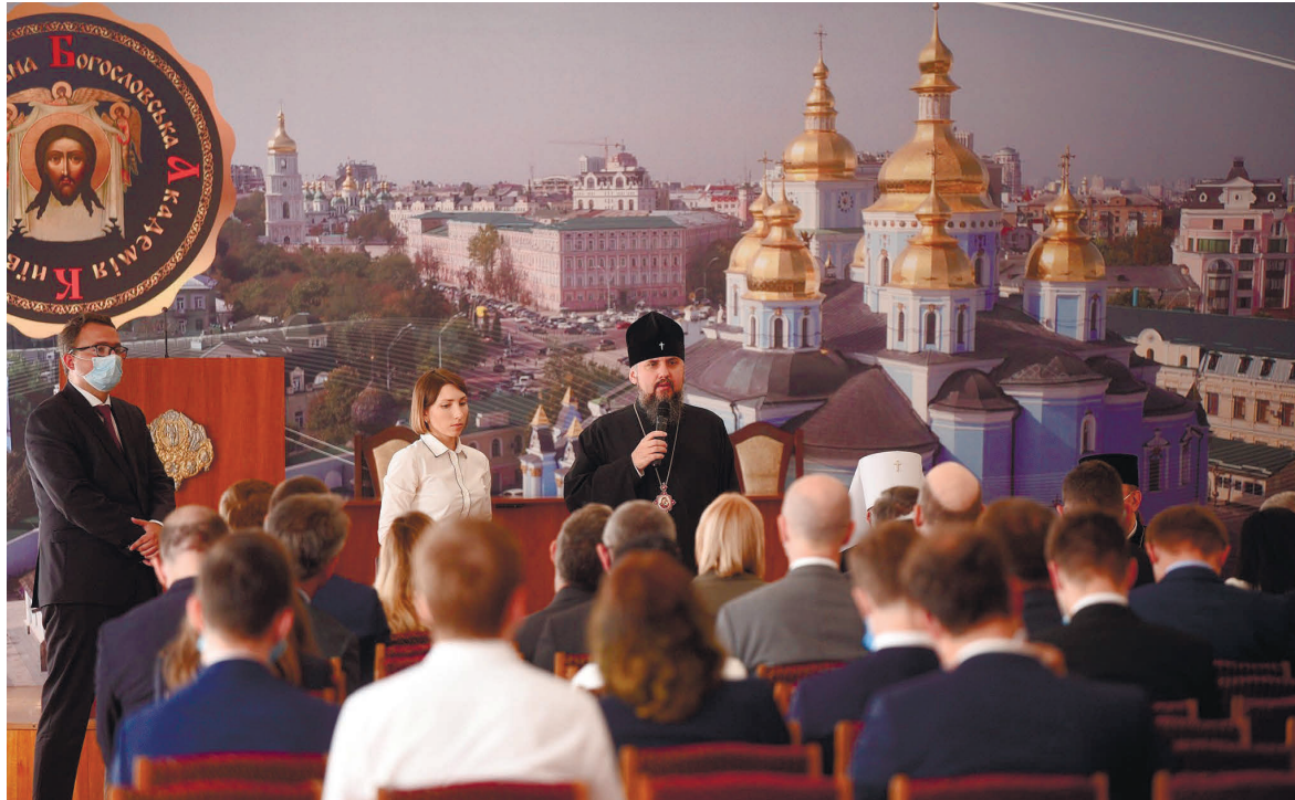
Зустріч іноземних дипломатів і керівників державних органів України з митрополитом Київським і всієї України Епіфанієм та митрополитом Сімферопольським і Кримським Климентом щодо стану релігійної свободи на тимчасово окупованій території Криму

Також він закликав українську владу та міжнародну спільноту зробити все можливе задля припинення утисків і насильства в окупованому Криму та повернення його до складу України як місця мирного й гідного співжиття всіх громадян нашої держави.