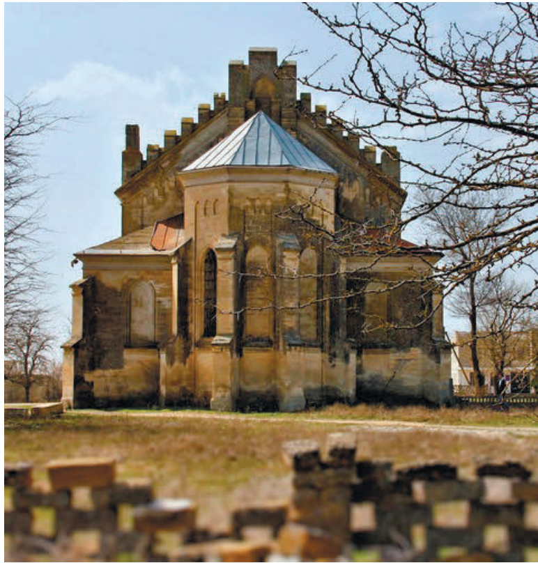
Руїни костелу Серця Ісуса Христа в селі Олександрівка Красногвардійського району