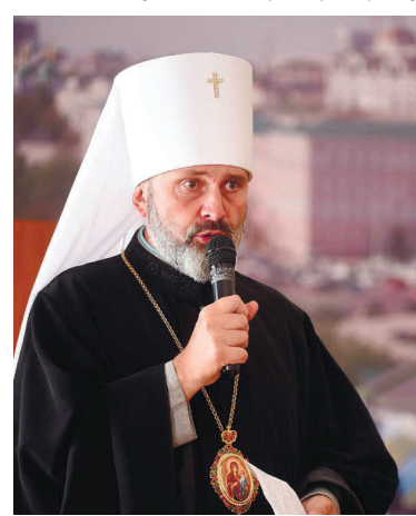
Виступ владыки Климента під час зустрічі іноземних дипломатів і керівників державних органів України з митрополитом Київським і всієї України Епіфанієм щодо стану релігійної свободи на тимчасово окупованій території Криму

28 жовтня 2020 року відбулася зустріч представників КРУК з народним депутатом України Рустемом Умеровим, під час якої народному обранцю було передано звернення до голови українського парламенту, де КРУК заклика-