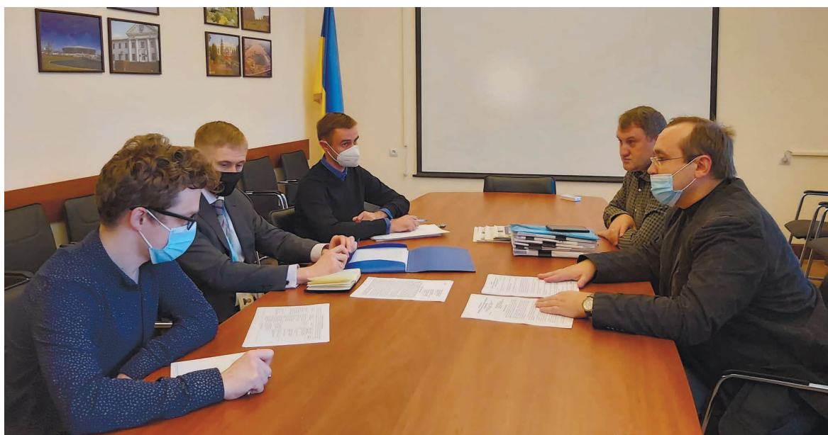
Зустріч із представниками Крайової ради українців Криму в Міністерстві з питань реінтеграції тимчасово окупованих територій, 27 жовтня 2020 року

17 лютого 2022 року Верховна Рада України прийняла в цілому постанову «Про деякі питання захисту права на свободу світогляду та віросповідання вірян Кримської єпархії Української православної церкви (Православної церкви України) та збереження приміщення Кафедрального собору святих рівноапостольних князя Володимира та княгині Ольги». За відповідне рішення проголосував 271 народний депутат.