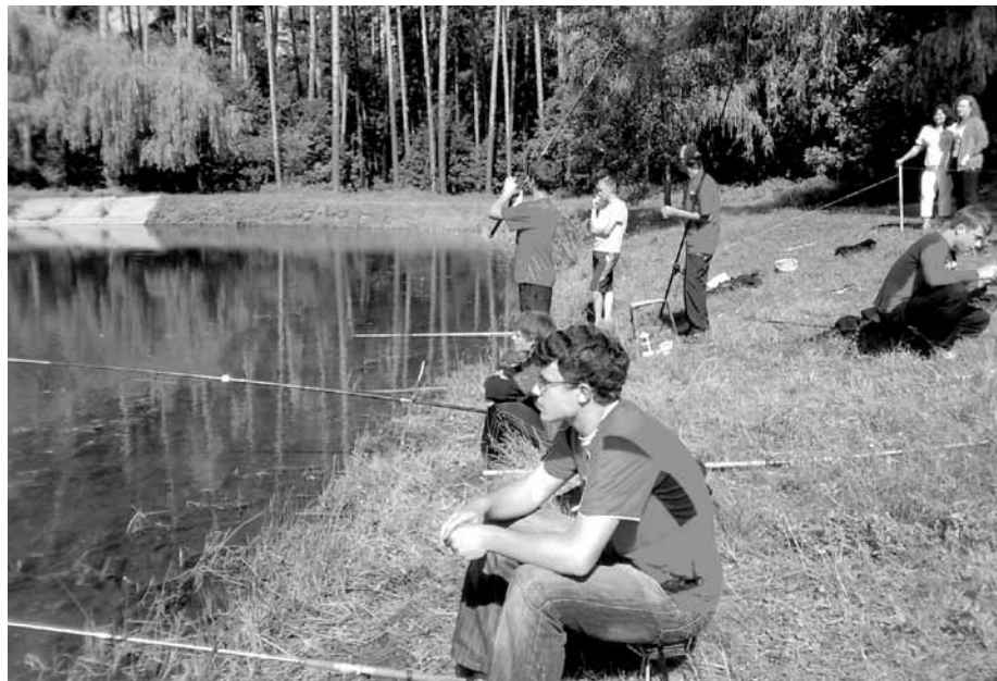
На фото: рибалки на березі річки.

Процес лову риби настільки захоплюючий, що з часом у новачків він нерідко переростає у всепоглинаючу пристрасть. Адже тільки посправжньому захоплені люди заради того, щоб побачити або відчути клювання риби, можуть забиратися в дуже віддалені й глухі куточки, годинами мокнути під дощем або мерзнути на морозі.