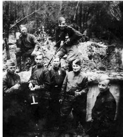
Мій праїд з своїми товаришами на фронті (на задньому плані – праворуч).