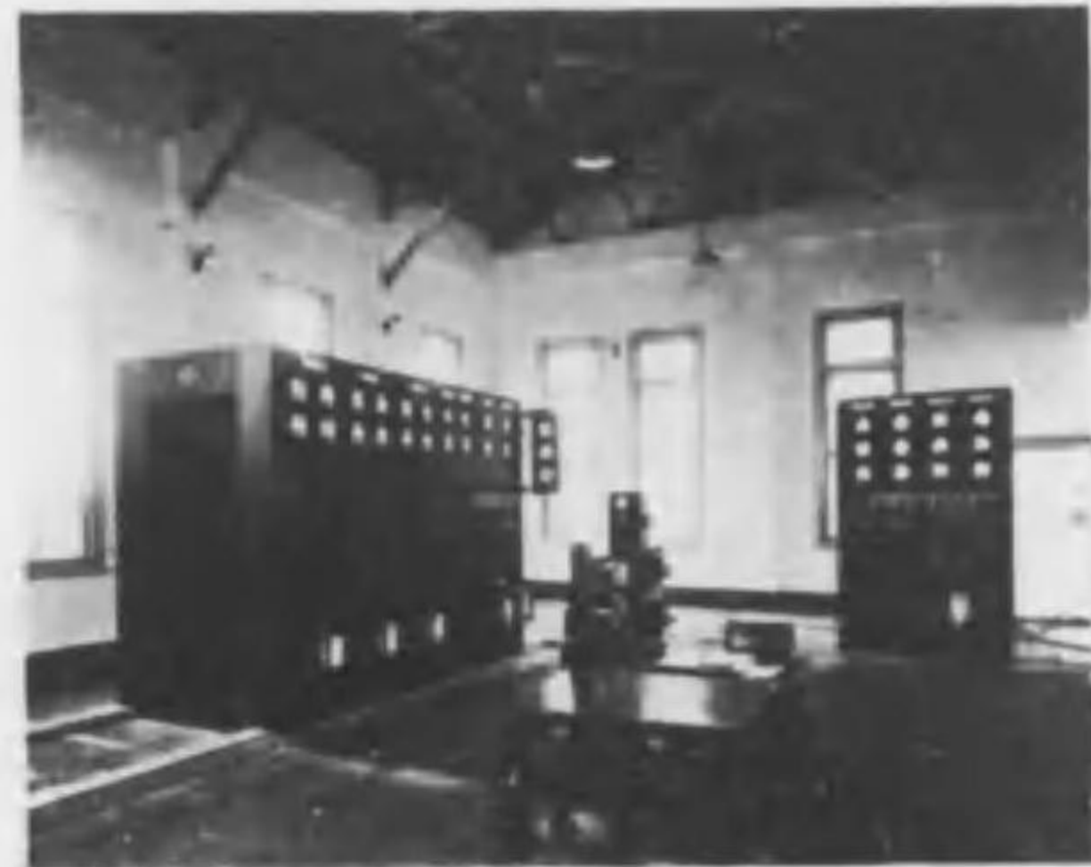
京都電燈觀音町變電所納配電盤