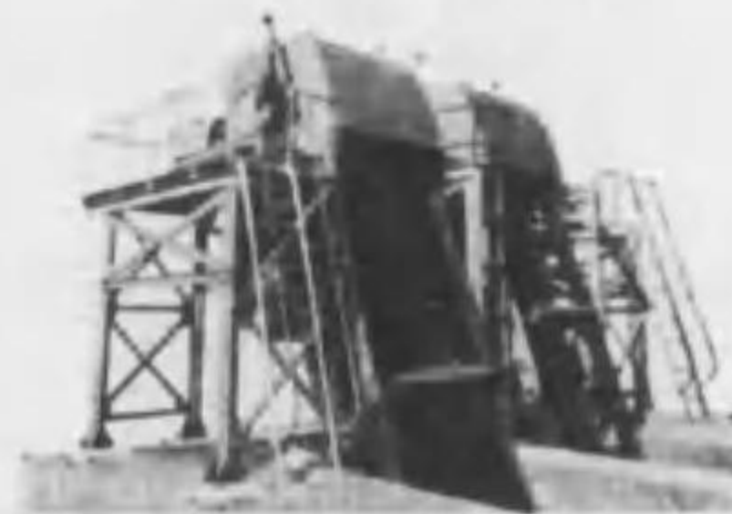
大阪市下水道津守海老江處理場納入