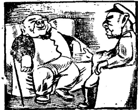
財政大臣和大元帥

眼睛紅得像鬼子眼睛一般。他從桌子上拿起一瓶「老篤眼藥」，把藥水滴在眼睛裡面；閉着眼睛，塞着鼻子說：「喂！大老官！」財政大臣坐在沙發上，因為重量太大了，所以沙發墊子一直壓到地上，財政大臣就像坐在皮地上。