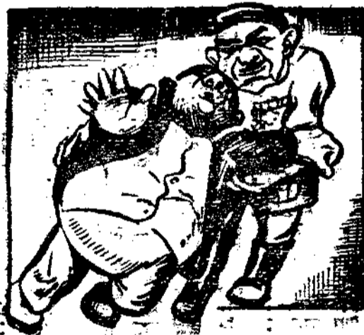
財把的熱親帥元大 來起扶上地從臣大政