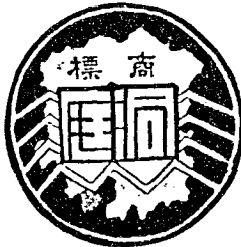
長沙洞庭印務館代印