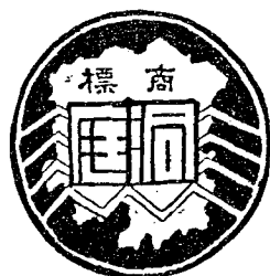
長沙洞庭印務館代印