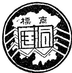
長沙洞庭印務館代印