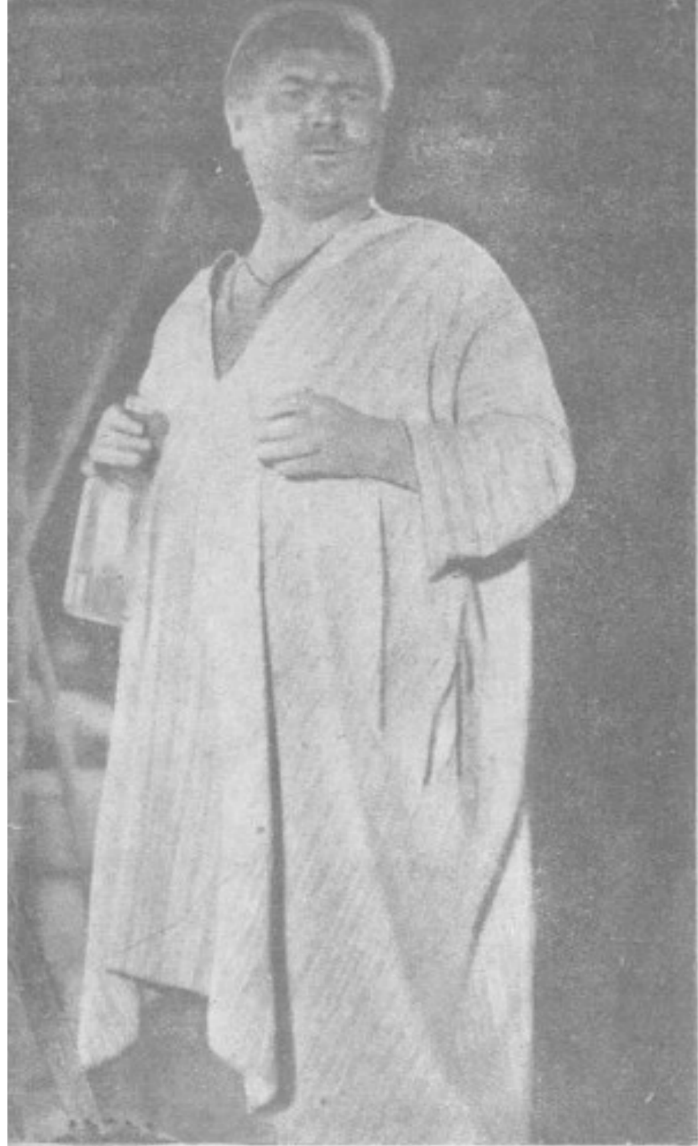
老 閔 之 像