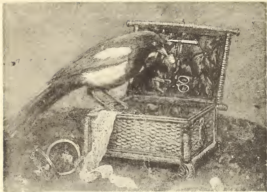
H. Bossuwé. La Pie voleuse. — De roovende Ekster.