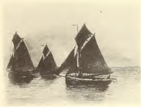
F. Cujé. Vertrek voor de Vischvangst. — Départ pour la Pêche.