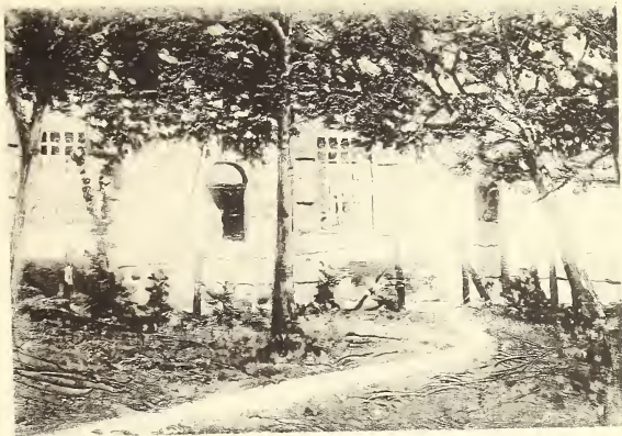
P. Van Kerckhoven. Ferme à Hoogboom. — Hoeve te Hoogboom.