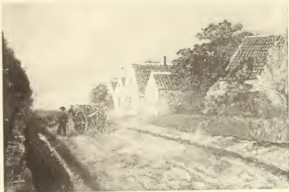
C. Hebbel. Après l'orage. — Na het onweder.