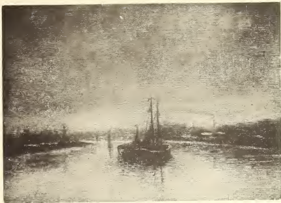
M. Ross. L'Escaut près de Burght. — De Schelde bij Burght.