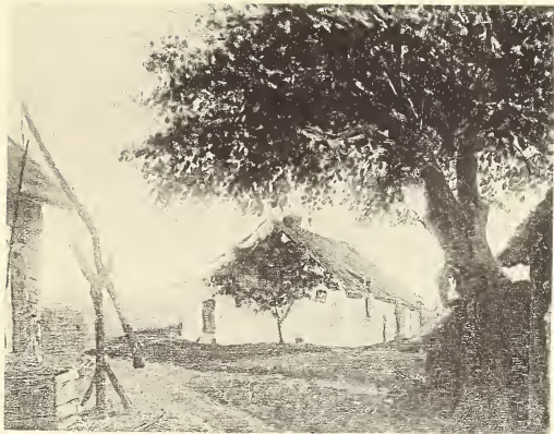
R. Sibick Après-midi d'été. — Zomernamiddag.