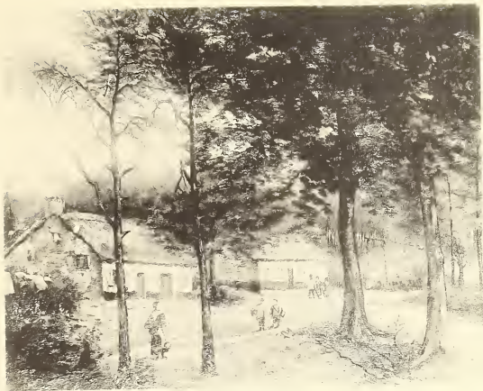
F. De Bruycker. Omstreken van Brasschaet. — Environs de Brasschaet.