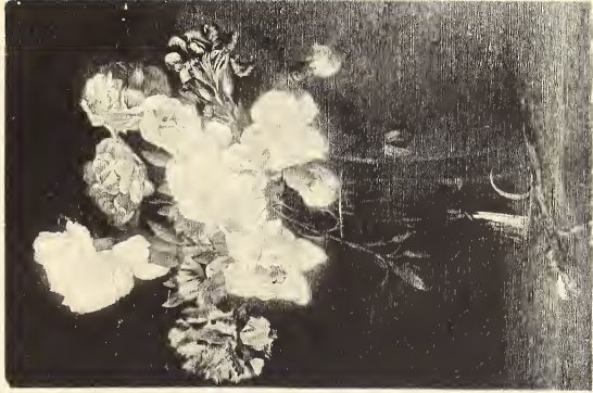
E. Cassiers. Geillefs, — Anjelieren.