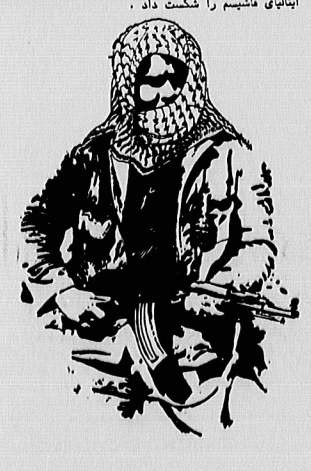
جلود ادامه داد: نیروهائی که وارد مائون سوادلی و مصر و سوادن شده‌اند هرگز از این مناطق خارج نخواهند شد، بلکه دامنه تجاوز آنها گسترش بیشتری خواهد یافت.

عبدالله جلود نخست وزیر لیبی در یک تاظهارت مطبوعه و سخنرانی در یک مجمع عمومی ایراد نمود و طی آن ضمن تکیه بر ضرورت مبارزه، حضور آمریکائی مستکبر را در منطقه محکم ساخت و از شامی ملت‌های عرب خواست تا بر برابر این تجاوزات امپریالیستی مقاومت کنند. وی در این سخنرانی گفت: ملت لیبی ایک از قدرت و ثروت و صلاح خود برخوردار است و بکویب از همه مقاومت و مبارزه برمی‌آید.