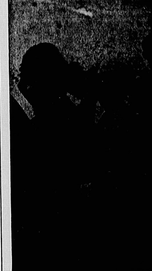
سادات خانن به مناجبه یکن ترویسست مرفوعه‌اعمال لیل نام جیب‌سازین خوش آمد می‌گوید و ایک حسنه- مبارک، داور نیگر آمریکا راه خائنانه او را فریضی فرات است.

افراد معدودی که به خاطر مرگ وی گریستندو آنگاه که شادی خود را پنهان ننمودند به یک اندازه مرتکب اشتباه شدند، اشتباه اول گروه آست کیمه خاطر مردی که به مقصدترین منافع خلق های عرب حیاتیات ورزیده نمی گردید: منافعی که علیه تحریکات مدمنه ها، توپنه ها، سوء قصد ها و بروز پنجنگ موفق شده است ضد ما میلیون زن و مرد را که در سراسر زمین پراکنده‌اند تحت یک انگیزه واحد، یک اراده واحد و یک نیروی واحد متحد سازد (۱) بخاطر کسی که به ژاندارم منافع قدرت های امپریالیستی و استعماری در جهان سوم و کارفرما و حامی مزدوران جاسوسان و ضد انقلابیون - بدان خاطر که آنها را موانع فزونی به نفع متدین و دوستانش وارد صل شونده - تبدیل شده بود، می‌گردید، برای هر صهیونیستی که در فلسطین که به یاد شهیدان قهرمانان (از: بولتن بررسی مطبوعات خارجی وزارت ارشاد اسلامی)