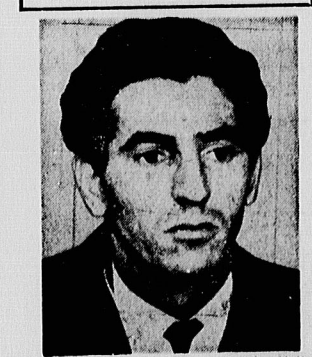
عبدالله جلود نخست وزیر لیبی: طرح «فهد» با طرح کاملاً آمریکائی است.

حافظ اسد رئیس جمهوری سوریه: اسرائیل خواهان صلح نیست.