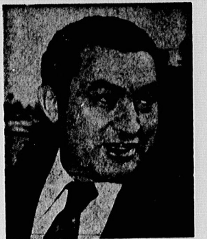
حسنی مبارک رئیس جمهور دست نشانده مصر

آیا نازی به یادآوری فراردها با موافقتنامه‌های مختلفی که تحت رهبری آمریکا طی سالهای ۱۹۵۰، ۱۹۶۰، ۱۹۷۰ میان کشورهای عرب و غیر عرب منعقد گردید یا طرح اولیه آن ریخته شد و جود دارد؟ فراردهای همچون صیقل بغداد، اتحاد نظامی میان رهبران جمهوری کابیل، شومون و واشنگتن که راه را برای بنای قدرت نژادگرای آمریکایی به لبنان باز نمود.