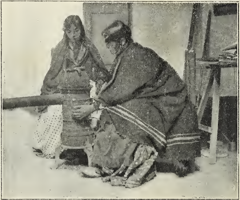
Algunas gitanas hacen de castañeras

— Anda, hijo... cara e piyo bendesío; que ties ojijos de enamo-