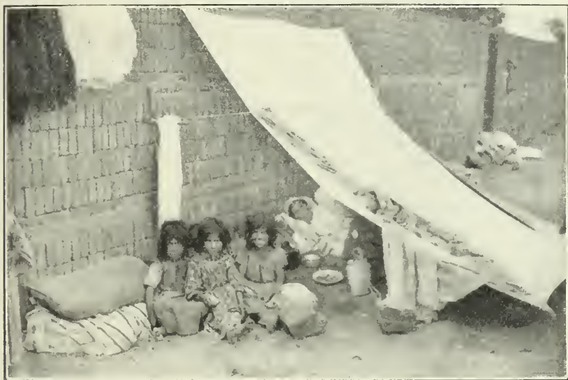
Los gitanos se parecen a los árabes en el vivac

sangrienta con las diferentes sectas en que se dividió el cristianismo, disputándose el goce de temporalidades y el predominio de unos poderes sobre otros... Y entonces aparecieron los gitanos, gente incrédula; que se mostraban indiferentes a todo cuanto les rodeaba, siempre que no estuvieran de acuerdo las cosas con su materialismo congénito; y así se manifestaron ante esos pueblos exaltados.