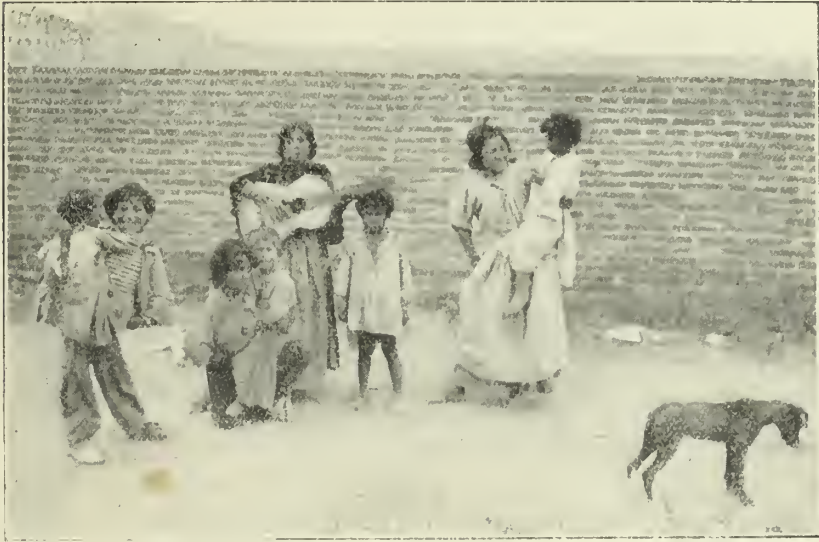
Los gitanos acompañan sus cantos con el rasguear de las guitarras en melodiosas notas y dulces acordes

Las danzas en Andalucía eran ya célebres cuando los cónsules.