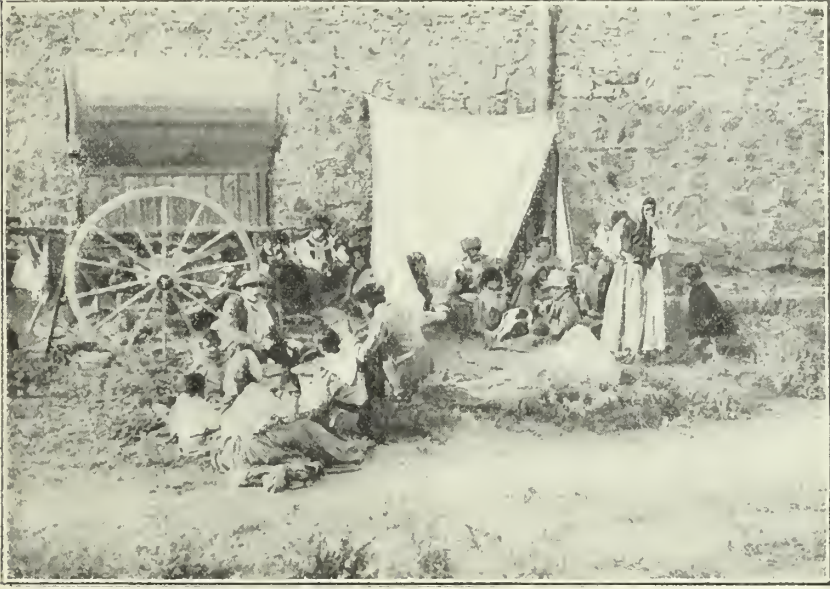
Los gitanos de España en general llevan vida errante y acampan en despoblado

Cuando acampan en despoblado, en un momento arreglan su co-