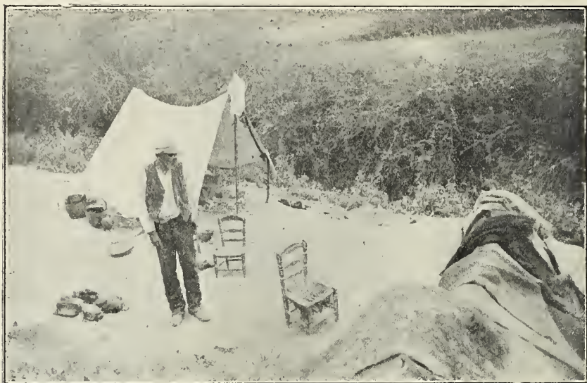
Los gitanos se resignan a todos los rigores por su amor a la independencia

tratan de vender o cambiar, obrando en el animal una metamórfosis para escamotear y ocultar provisionalmente sus defectos y lacras; le tiñen el pelo, disimulan sus mataduras, atontan y emborrachan a las bestias resabiadas y falsas; y es seguro que han de sacar por una caballería cualquiera el triple del precio que a ellos les costó; dado caso de que les haya costado algo; pues nada de extraño tiene