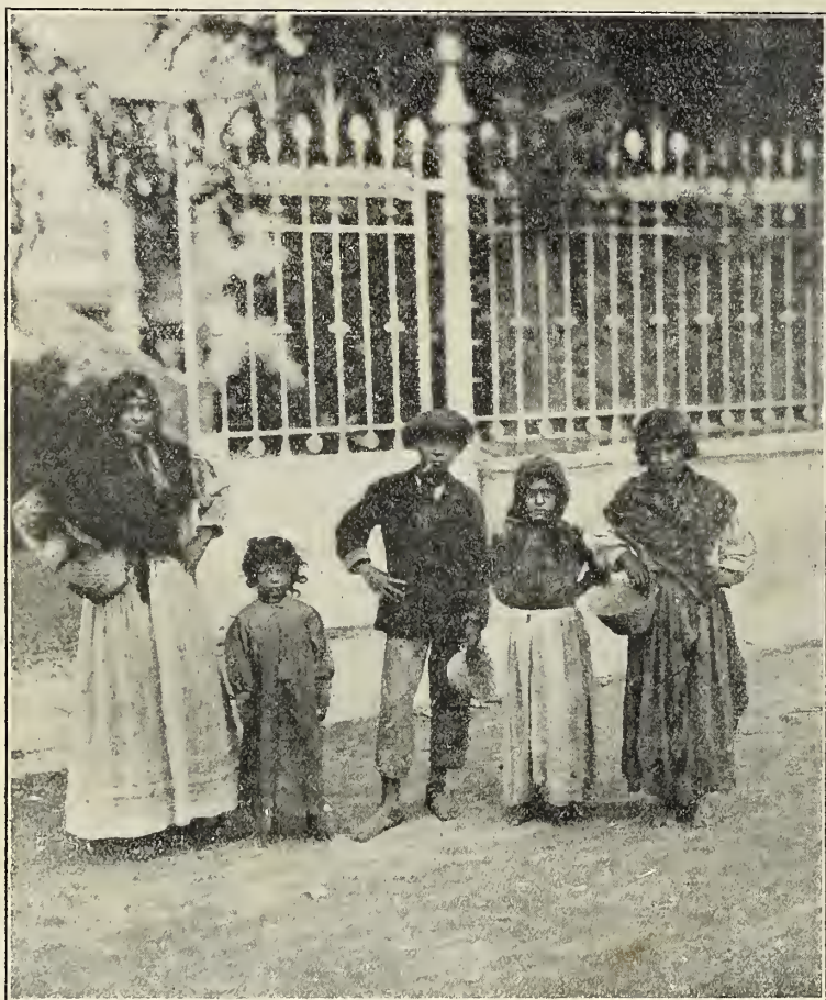
Una calorri con sus chavales

Al llegar a la feria rompen filas, y cada cual se dedica a sus faenas propias: ellas, unas cuantas, preparan las buñolerías, y las demás circulan entre el público implorando la caridad ( brichardilan-