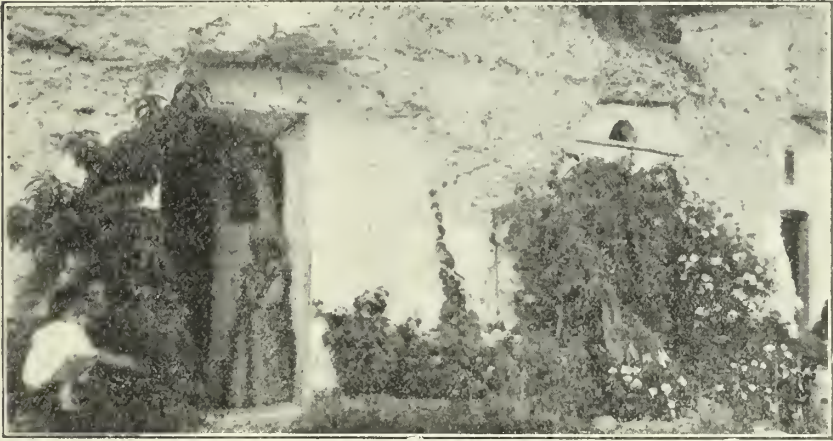
Entrada de una posada gitana

El Tribunal superior de Utrech dicta sentencia, en 1545, contra un