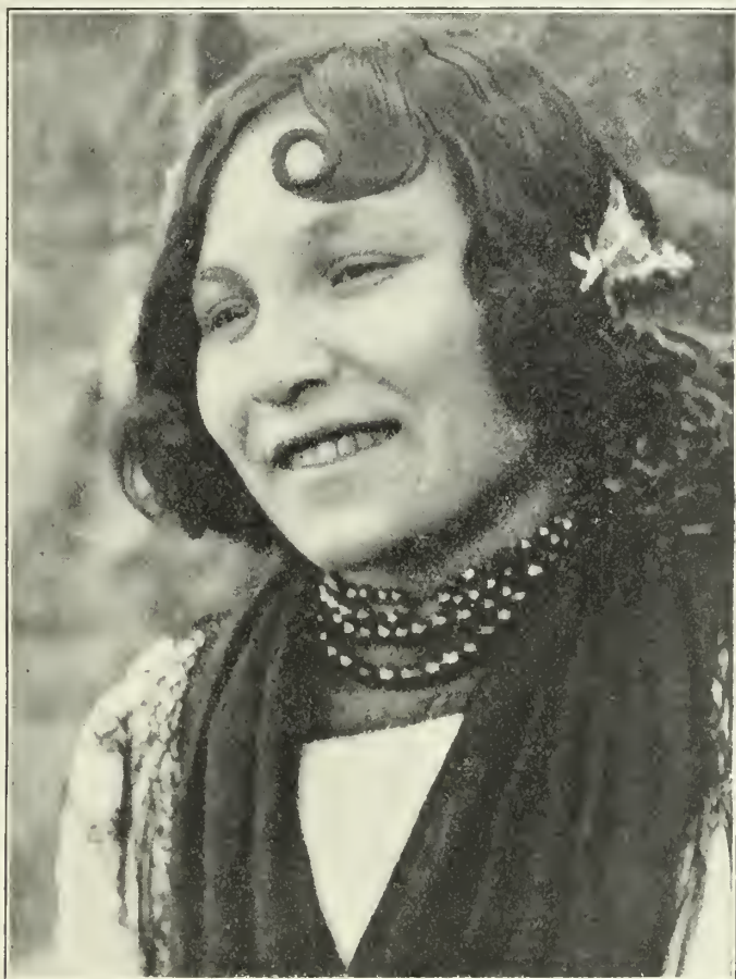
Los ojos de la gitana reflejan vagos y soñolientos la expresión del placer

con la chusma sarracena, no hubieron de fijar una atención especial de parte de los cristianos españoles, hasta después de la conquista de Granada, cuando empezó a predominar la política del Arzobispo