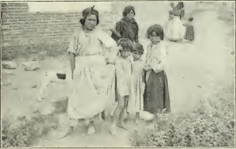
Hasta en los harapientos niños se advierte la singular y profunda fijeza de su mirada

Los gitanos toman por asalto el mercado: en lo más animado, y nutriendo los grupos que rodean a las caballerías, se les ve siempre, destacándose entre todos por su continuo manotear, gritar, girar de un lado a otro, moverse como energúmenos, hacer aspavientos, llamar a los propietarios, tratantes y corredores, elogiando