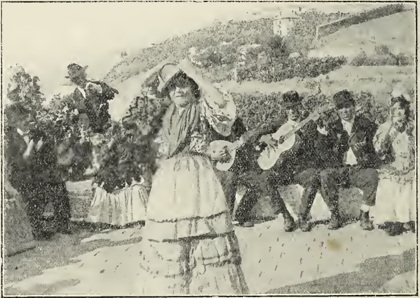
En los bailes típicos gitanos, baten palmas los acompañantes, se golpea el suelo, y se jalea con el gesto y la palabra

El cantaor , echada la cabeza atrás, entorna levemente los ojos, y con voz de timbre varonil, bordando el encaje de su sentimien-