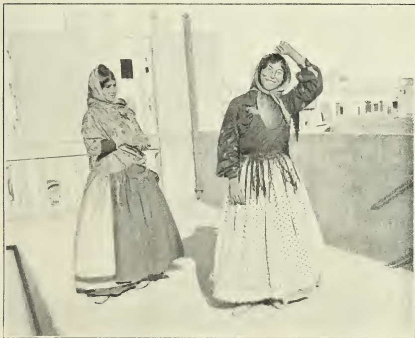
La imaginación viva y desordenada de la gitana se manifiesta en su semblante y en todas sus actitudes

Renueva la pragmática de sus abuelos el emperador Carlos V en