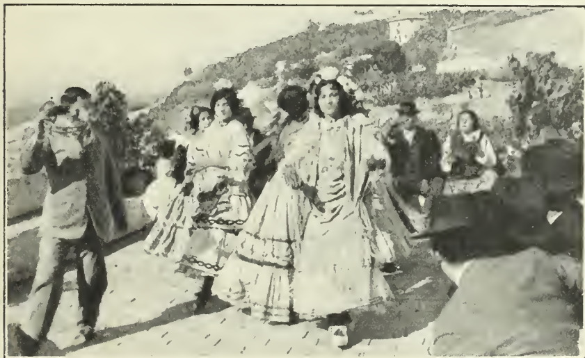
La coreografía andaluza y flamenca recuerdan mucho de las danzas de las bayaderas y odaliscas

El traje del gitano varía, según el país donde habita. Tanto en el Rosellón como en la parte Norte de Cataluña, en el primer ter-