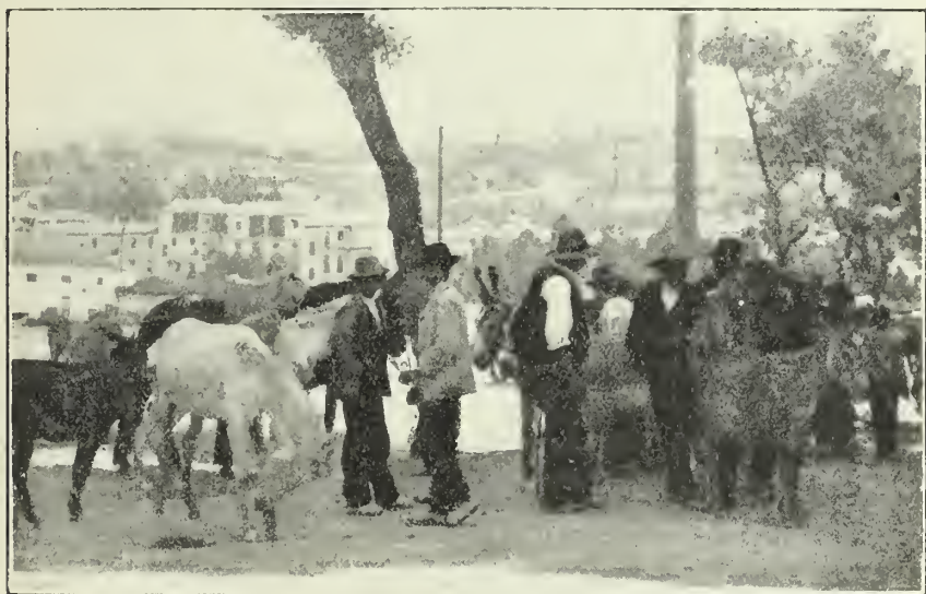
Los hombres se ejercitan en la compra, venta, cambio y corretaje de caballerías

Las mujeres gitanas venden el menudo de las reses en la plaza, aliñan y fríen morcillas de sangre en las tabernas, asan castañas, con-