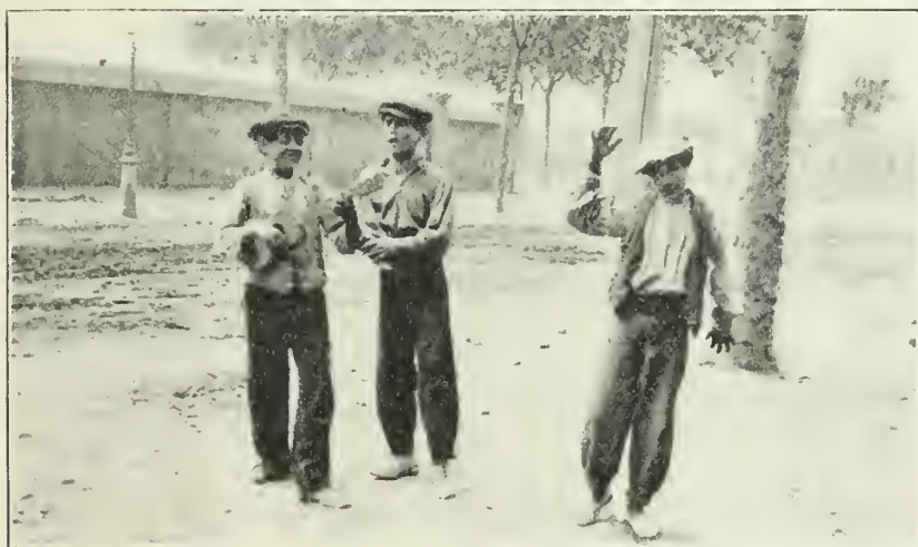
La pasión de los gitanos por la vida independiente crece con la edad

Admira lo sufrido que se presenta el gitano ante la adversidad, y la increíble obstinación con que este pueblo aislado, replegándose en sí mismo, por decirlo así, se ha resignado a la miseria, al oprobio y a la suerte de los vencidos. Resulta del mismo aislamiento en que se encuentra colocado, que, habiendo contraído el hábito de