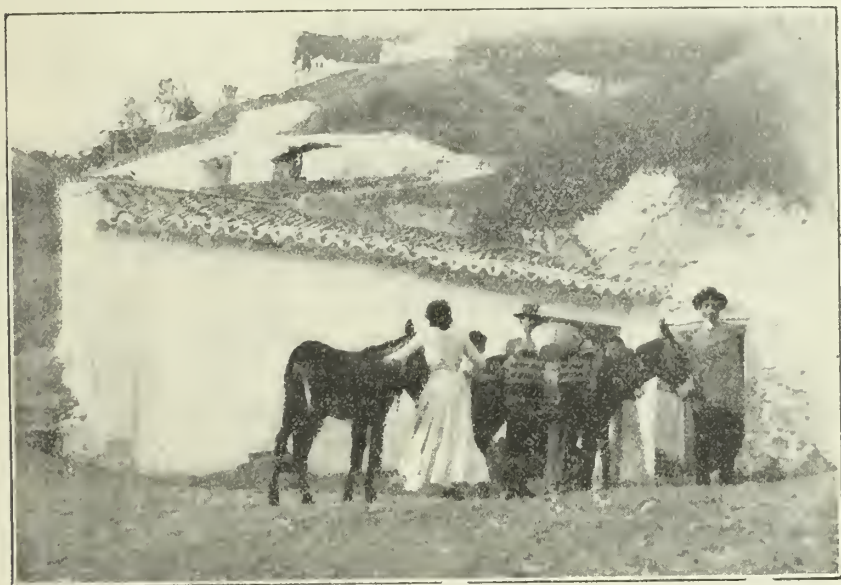
Gitanos andaluces acomodados

contra los gitanos, que Carlos III comenzó por combatirlos antes de declarar a estos desgraciados dignos de poder dedicarse a las artes. Los principales artículos de esta ley previenen: que los que se dicen gitanos no lo son por origen ni por naturaleza, ni proceden de raíz infecta alguna: se prohíbe nombrarlos con las voces de gitanos o castellanos nuevos , bajo las penas de los que injurian a otros de palabra