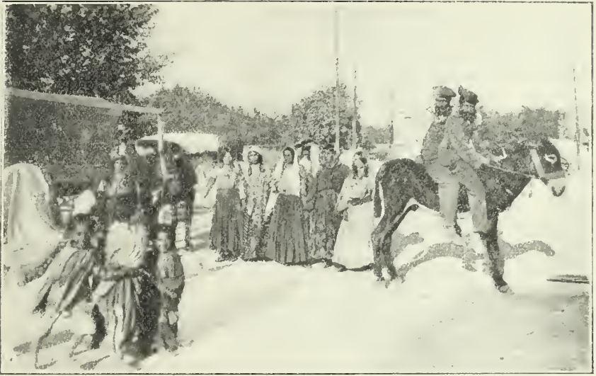
Grupo de gitanos