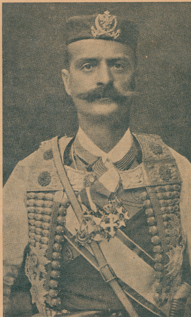
Бригадир Митар Мартиновић командант примореке црногореке војске

Према вестима које су јуче стигле из Цариграда борбе се још непрестано продужују око Берана.