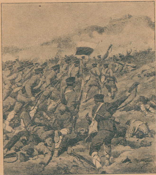
Бугари јуришају на Турке у битци код Луде-Бургаса

Поред саме пруге постројен је одред болничара са носилима, а више њих, један поред другог, до саме топчидерске трошаринске станице, наређани су фијакери који имају да од-