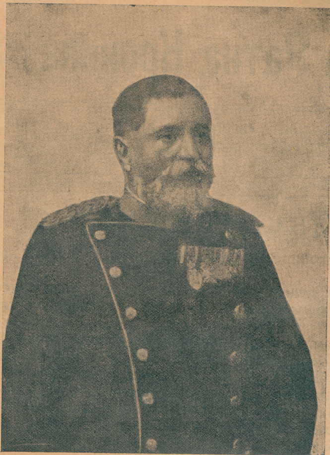
Војвода Радомир Путник шеф ерпеког генералног штаба