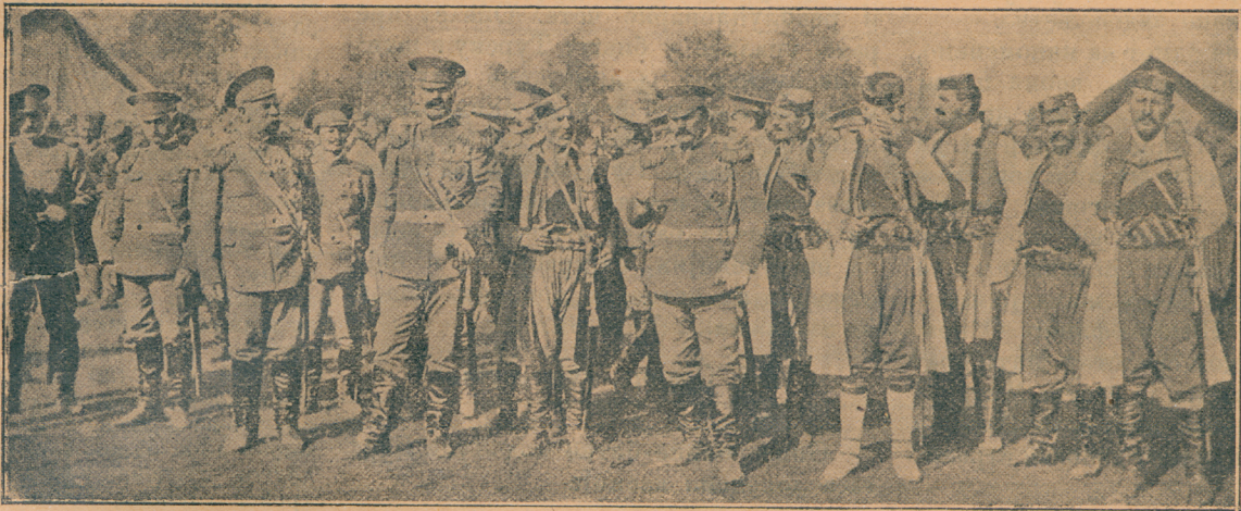
Храбри црногорски официри

везу теже рањенике до војне болнице. Трамвајски саобраћај је обустављен. Код монсполске трамвајске чекаонице стоји један трамвајски воз са неколико вагона да прими лаке рањенике и одвезе их уз оно брдо више монопола до Губеревца.