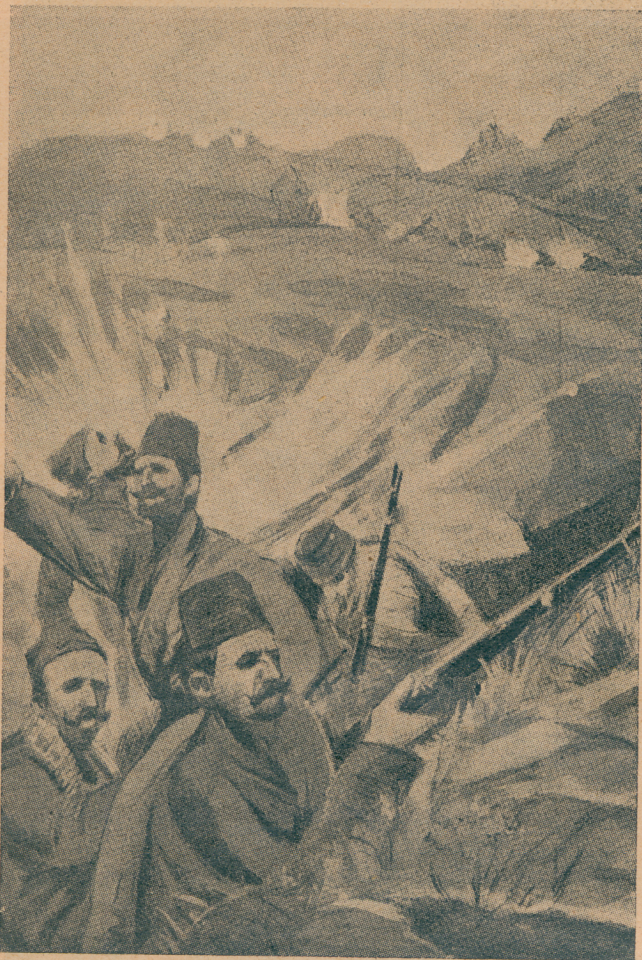
Призор из Кумановске битке

љеном меморандуму који је објашњава а да, као доказ свог пристанка, опозове декрет о свој мобилизацији.