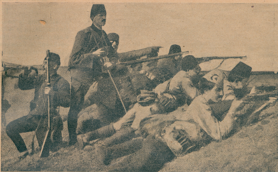
Призор из Кумановске битке

армијом ђенерала Степана Степановића, која је ишла из Бугарске преко Ђустендила ка Игри-Паланци и Кракову. Ђенерал Степановић имао је под својом командом две српске пешачке дивизије, два коњичка пука, потребну артиљерију и остале помоћне трупе у јачини око 45.000 људи, а сем тога и једну бугарску пешачку дивизију.