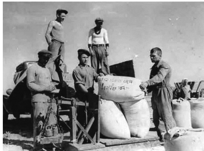
Колгоспники сільгоспартелі «Завет Ленина» Джанкойського р-ну. 1940-ві роки