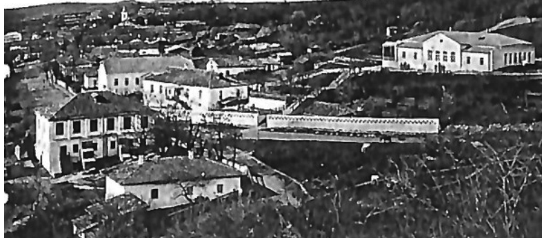
Німецькі колонії у Судаку (фото початку XX ст.)

Переселенню сприяли високі, порівняно з іншими губерніями, зарплати, які виплачувалися ро-