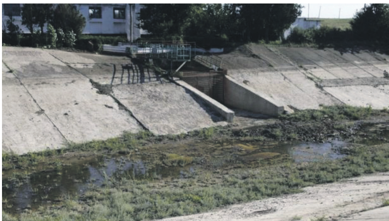
Нинішній стан Північно-Кримського каналу

індивідуального підприємства провели чистку річища без будь-яких документів на роботи, а також не приділили жодної уваги тому, щоб урятувати мешканців річки: змії, черепахи і мальків «нахабно вичерпували ковшем до машини і вивозили за місто, де викидали».