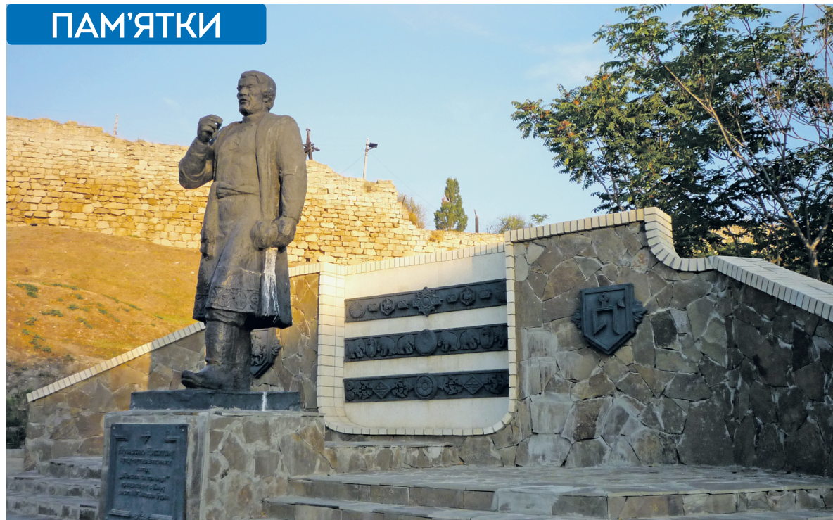
Пам'ятник Афанасію Нікітину в Феодосії

Афанасій Нікітін вирушив у свою комерційну подорож у 1468 році. Нині в Росії курсує пасажирський потяг «Афанасий Никитин» сполученням Москва – Санкт-Петербург, хоча з точки зору історичної справедливості ліпше було пустити його за маршрутом Твер – Нижній Новгород – Астрахань – Дербент. Вихавши з Твері, Нікітін проїхав з торговим караваном Калязін, Углич, Кострому, Казань та саму тодішню столицю – Сарай, а потім плув Каспійським морем до узбережжя сучасного Дагестану, де розбійники захопили одне з купецьких суден та забрали в полон людей. У Дербенті Нікітину вдалося умовити представника ширванського шаха посприяти у звільненні бранців.