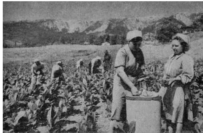
Збір тютюну в колгоспі ім. Калініна