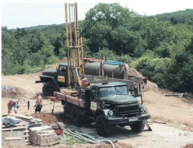
Буріння свердловин у Криму

ся до праці з пошуку підземних вод у Криму.