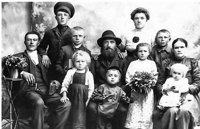
Російська сім'я, нащадки російських переселенців у Крим XVIII ст., у селі Мазанка (фото початку XX ст.)

Вимушена еміграція кримських татар і переселенська політика царизму змінили етнічний склад Таврійської губернії. Чисельність росіян, українців та білорусів (під загальною назвою «росіяни») на початок 1860-х рр. становила 370,5 тис. осіб, татарського населення – 100 тис., німців – 45,7 тис., болгар – 21,4 тис., євреїв – 14,3 тис., греків – 13,3 тис., вірмен – 6,3 тис., естів – 800, чехів – 600 осіб. Загальна чисельність населення досягла 573 тис. осіб 3 .