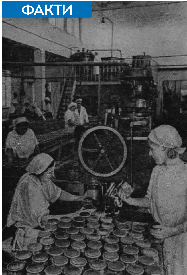
Овочевий цех Сімферопольського консервного заводу «Трудовой Октябрь»

Урожайність овочевих культур у повоєнні роки в області порівняно з 1940 роком зменшилась майже удвічі і складала у 1950 році – 50,9 ц/га, а в 1953-му – 55 ц/га. В той час як у 1940-му урожайність городини в 4-х кримських господарствах досягала 118,2 ц/га. Стосовно ж досить важливої для Криму продовольчої культури, другого хліба, – картоплі, то ця позиція виявилася досить провальною. Її площа порівняно з 1940 роком скоротилася майже удвічі (з 10,7 тис. до 5,5-5,9 ц/га у 1950 і 1953 рр.). У 1954 році площі картопляних плантацій в області планували довести до 8 тис./га, тобто майже на 3 тис./га менше порівняно з довоєнним рівнем. Урожайність картоплі у Криму навіть у 1940 р. була нижчою в країні (69,4 ц/га). Проте у перше повоєнне десятиліття вона не перевищувала 29-30 ц/га. У такому ж