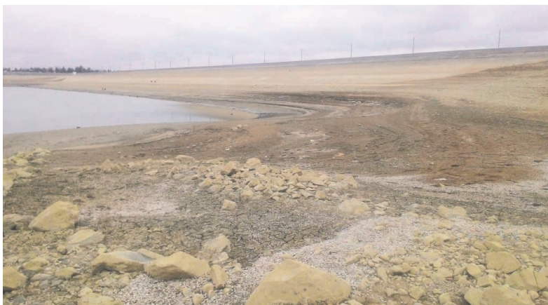
Тайганське водосховище, кінець травня 2018 року

До того ж увагу привертає «очищення» кримських річок на прикладі ситуації з Мелек-Чесме у Керчі наприкінці 2017 – на початку 2018 рр.: за даними місцевого відділення руху «Антикорупційне бюро Криму», громадські діячі протягом 2017 р. вимагали від міської «влади» чистки річища, вислуховуючи відповіді про те, що кошти не передбачаються для «водних об'єктів, які належать РФ». У середині грудня 2017 р. співробітники місцевого