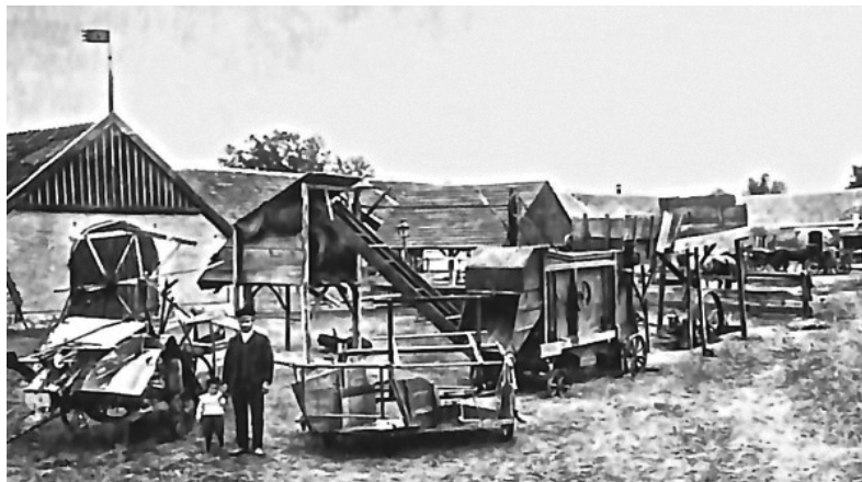
Німецькі колонії у Судаку (фото початку XX ст.)