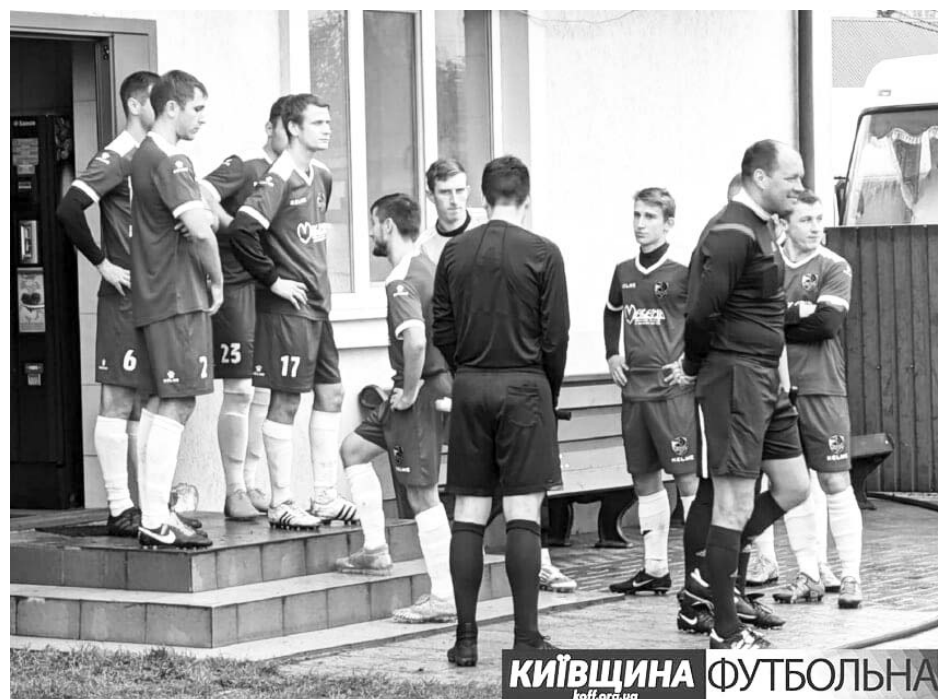
КИЇВЩИНА ФУТБОЛЬНА koff.org.ua