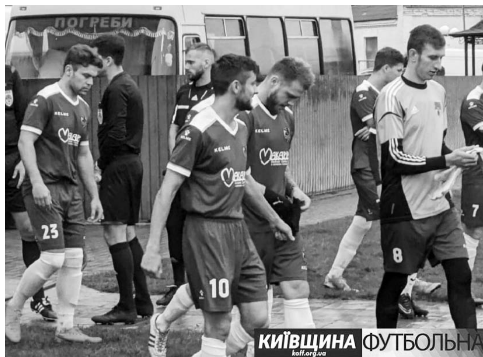
КИЇВЩИНА ФУТБОЛЬНА koff.org.ua