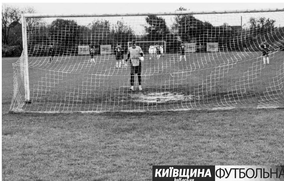
КИЇВЩИНА ФУТБОЛЬНА koff.org.ua