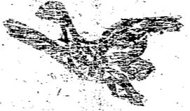
送附下剪標願把的信通要

投稿諸君：本報最歡迎不滿千字的短篇社會雜聞和小說。本報編輯部白。通信諸君：本欄祇登不滿三千個字的短信。請照例作就寄來！編輯部啟