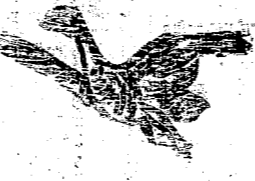
送附下剪標碼把的信通要

宗旨 實行工讀互助 名額 不限專收工人程度年齡不拘 入學 半年畢業 時間 下午六時至八時止星期日休息 學費 不收 介紹 國語算術珠算簿記應用文法 課程 國語算術珠算簿記應用文法 校址 附設司馬里建本女校