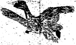
送附下剪欄欄把的信通要