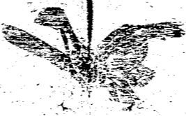
送附下剪欄欄把的信通要