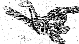
送附下剪標欄把的信通要

不認識，將來又有甚麼好結果... 呢？兒願兒死之後，世上再沒... 有兒這樣的婚姻出現，那兒難... 死，也就含笑於九泉了。兒難... 望你們保重自己，切記不要聖... 念。