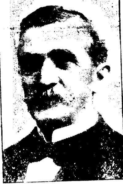
EMILE S. ECUIER Président de l'Union Française.

DATES DES REUNIONS — Réunions le premier jeudi de chaque mois.