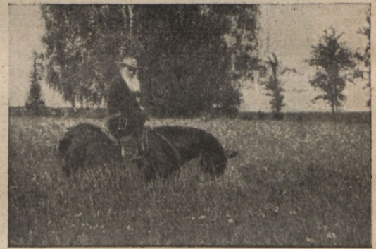
Л. Н. Толстой. (Изд. откр. пис. В. Черткова).