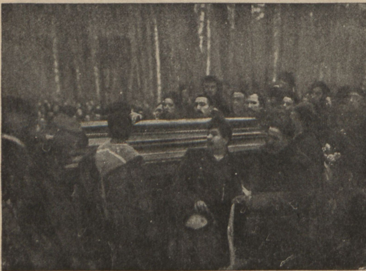
Опусканіе гроба Л. Н. въ могилу. (Вечерній снимокъ).