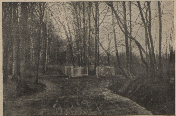
Могилы Л. Н. (15 ноября с. г.).