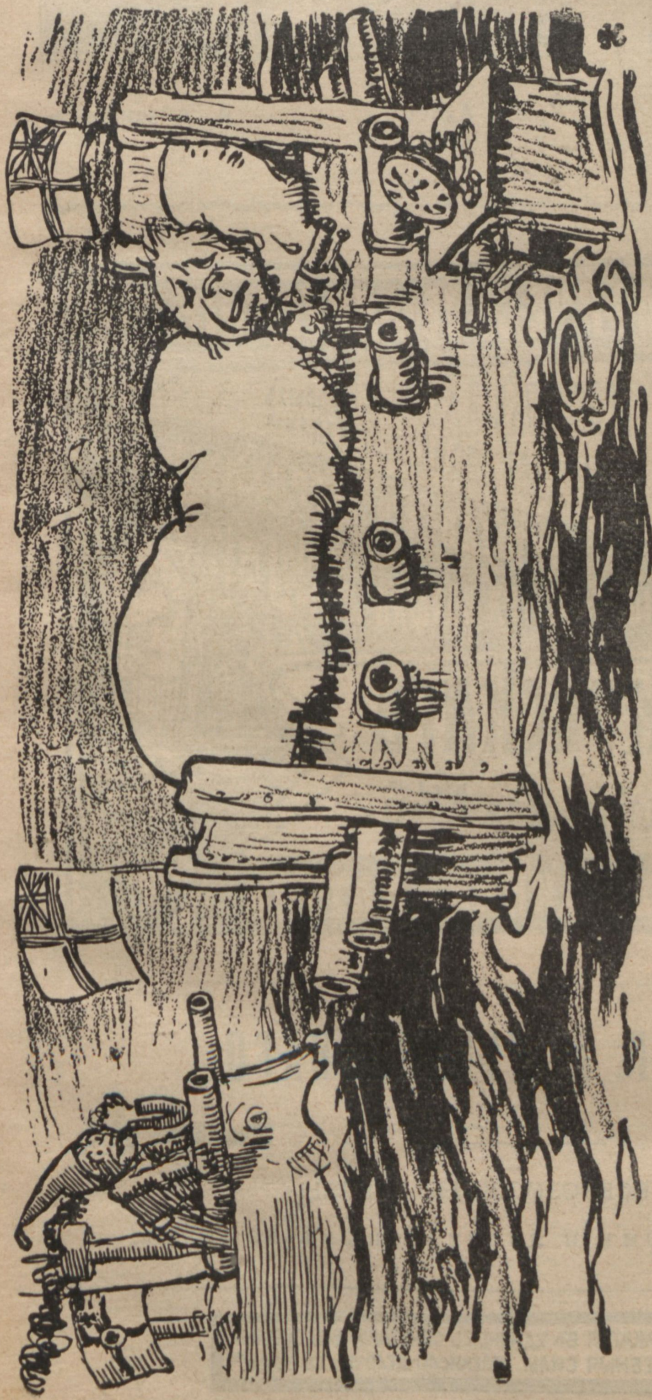
Бѣдный Джонъ Бульль все еще очень взволнованъ грезами. Въ отчаяніи онъ велѣлъ соорудить себѣ патенто-ванное ложе, чтобы разрушить бомбами свои грезы. („Jugend“).