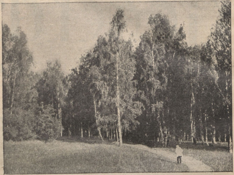
Л. Н. Толстой въ Ясной Полянѣ. (Изд. откр. пис. В. Черткова).