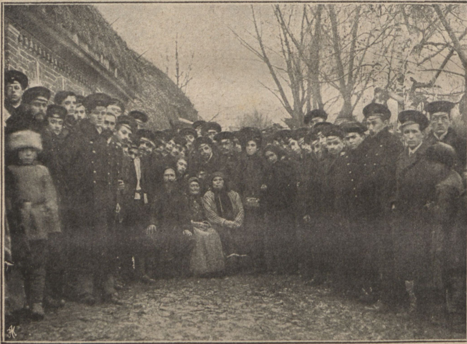
Кіевскіе студенты въ Ясной Полянѣ.