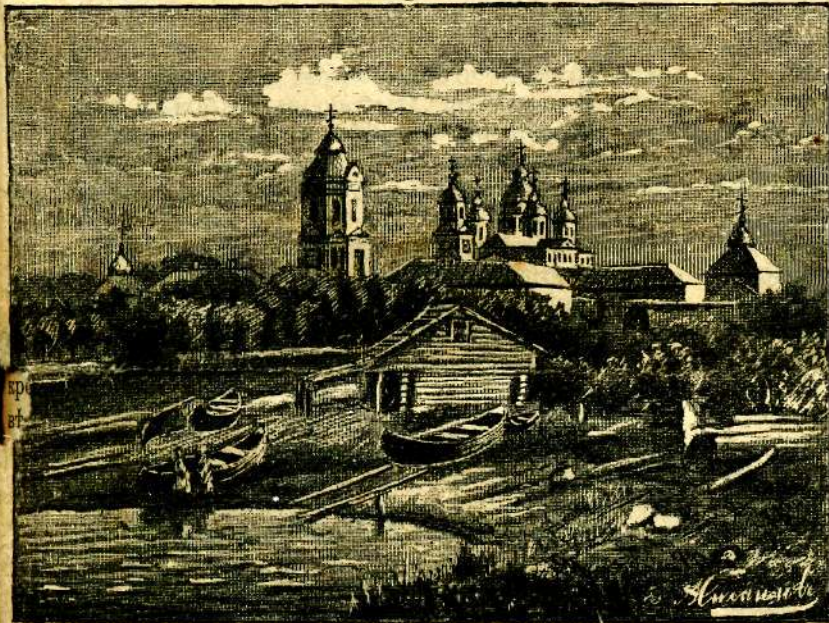
Коневскій монастырь на Ладожскомъ озерѣ.

— Какъ бы хотѣлось набрать побольше воздуха въ грудь и крикнуть на весь міръ крещенный: люди,