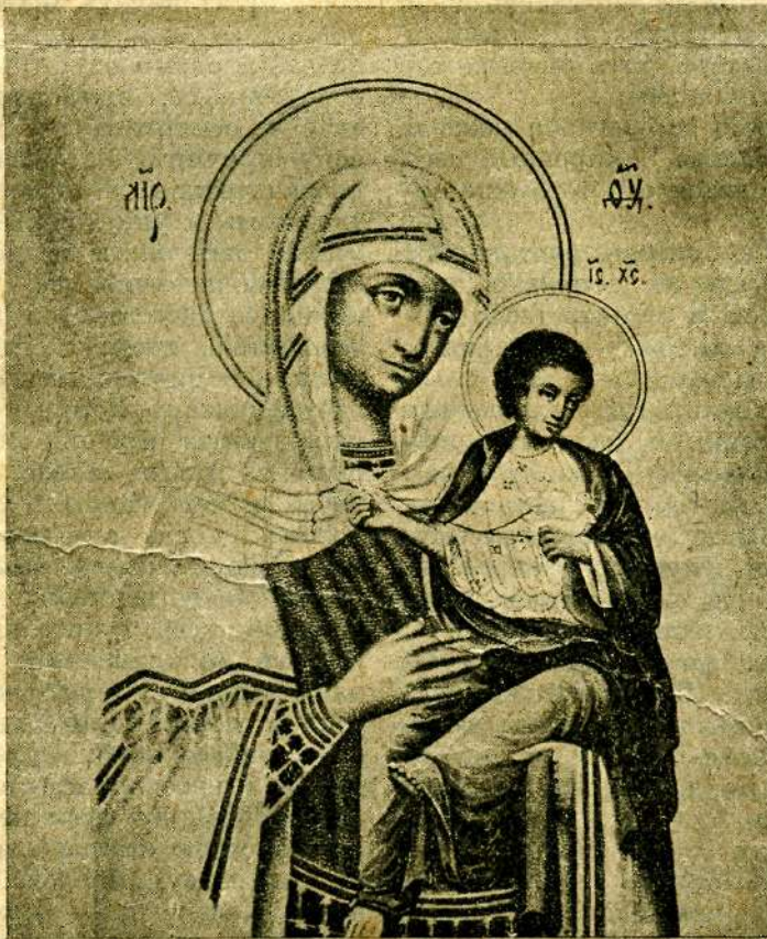
Точная копія чудотворной иконы Божіей Матери „Коневскія“, находится въ Коневскомъ монастырѣ, на Ладожскомъ озерѣ; принесена съ Авонской горы преп. Арсеніемъ Коневскимъ въ 1393 году.

Къ кому возошю, Владычице, къ кому прибѣгну въ горести моей, аще не къ Тебѣ, Царице небесная? Услыши убо стѣнаніе мое и приклони ухо Твое ко мнѣ. Владычице Мати Бога моего, и не презри мя, требующаго Твоея помощи, и не отри ни мене грѣшнаго. Вразуми и научи мя, Царице небесная: не отступи отъ мене, раба Твоего, Владычице, за роутаніе мое, буди Мать мнѣ и Покровительница. Вручаю себе милостивому покрову Твоему, аще токмо восхощеши устроить о мнѣ. Приведи мя, грѣшнаго, къ тихой и безмятежной жизни, да плачуся о грѣхахъ моихъ. Царице моя преблагая и пребыстрая Заступнице покрый Своимъ ходатайствомъ моя прегрѣшенія, защиты мене