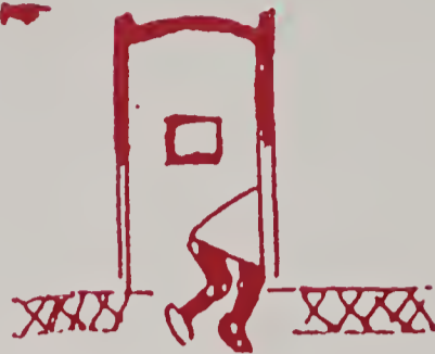
Thường mắc tiểu (nhất là về đêm)