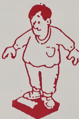
Thân hình mập béo (vòng bụng hơn 1/2 chiều cao)