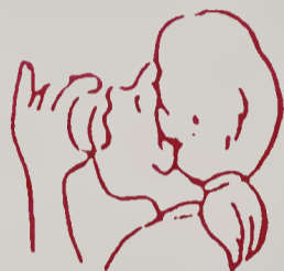
Khát nước đến tột cùng