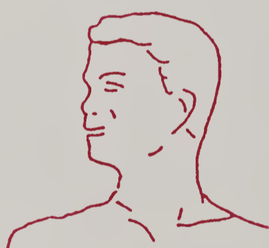
Sinh lý suy yếu