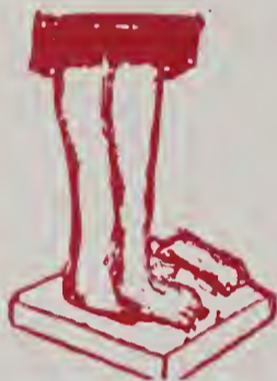
Sụt cân bất thường