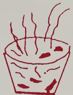
Luôn đói bụng (nhất là sau khi ăn)