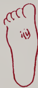
Vết thương không lành