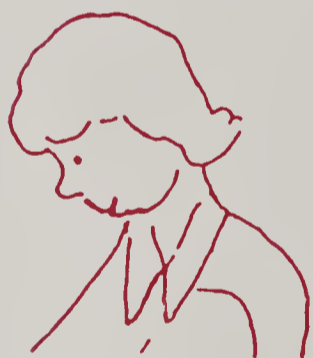
Nhiễm trùng của mình (ngứa)

(Cho Bác Sĩ mắt biết bạn bị tiểu đường, kính không thể là giải pháp)