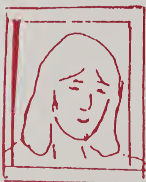
Có thân nhân bị tiểu đường

Nồng độ đường trong máu cao hơn 120 mg/dl (xét nghiệm bởi đơn vị chuyên nghiệp)