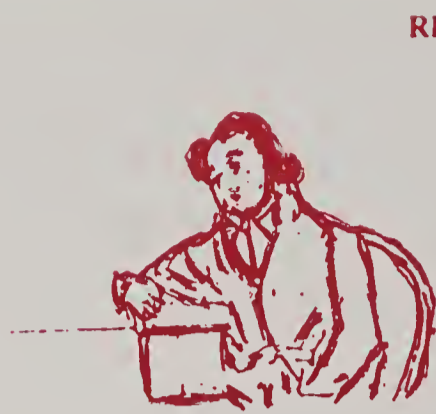
Luôn luôn mệt mỏi