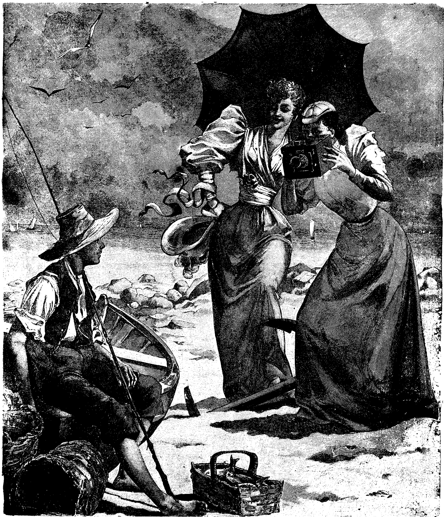
FOTOGRAFIARE LA MINUTĂ.