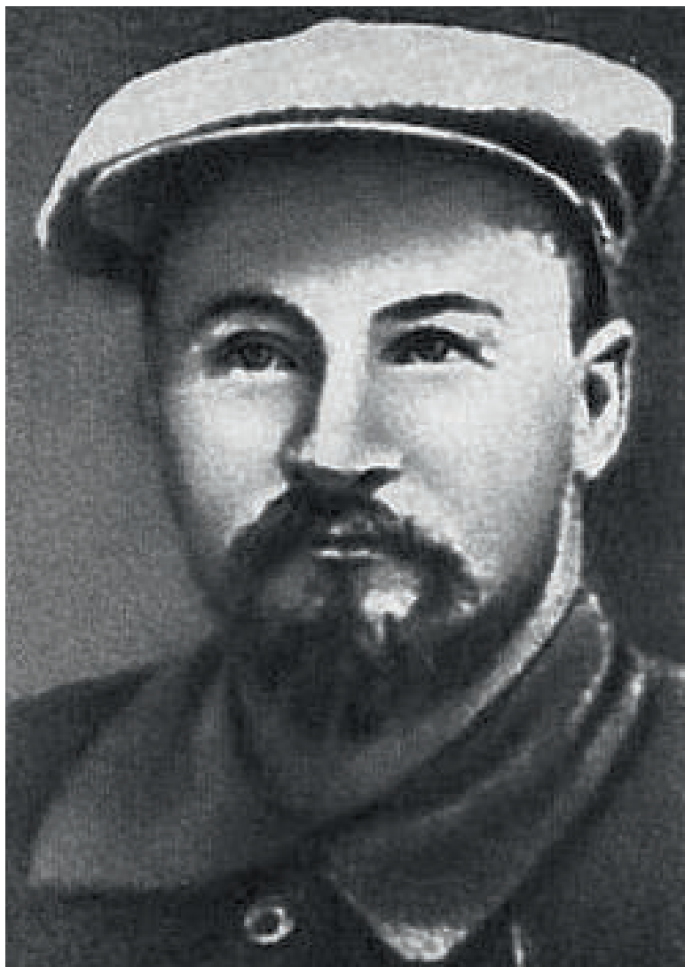
Юрій Гавен (Ян Ернестович Дауман), у травні-червні 1919 р. — головуєчий Кримського обкому РКП(б), нарком внутрішніх справ і член президії Кримської РНК.

зукін, які вже евакуювалися, на своєму засіданні в Одесі вирі-