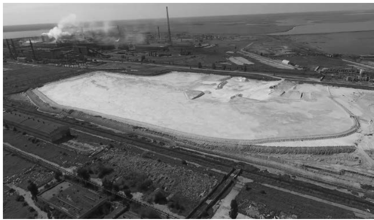
Кислотонакопичувач «Кримського Титану»

нюють, сушать, а потім розкладають у концентрованій сірчаній кислоті. Оброблений діоксид титану висушують і передають на мікроподрібнення, після чого упаковують і відправляють на склад. До теми ільменіту ми повернемося у цій статті нижче.