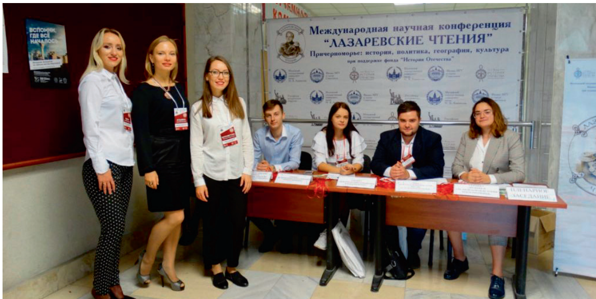
XVII Міжнародна наукова конференція «Лазаревські читання». Причорномор'я: історія, політика, географія, культура» у Севастопольській філії МДУ, вересень 2019 р.

нагадавши про визнання дипломів цього «вишу» в його країні. Також він додав, що робитиме все задля зростання кількості сирійських студентів «КФУ», яких на той час було лише троє – у «медакадемії» та на підготовчому відділенні «академії будівництва та архітектури».