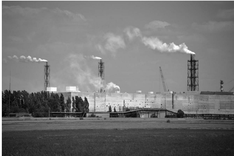
Завод «Кримський Титан»

«Кримський Титан» — підприємство з виробництва титанової продукції, потужності якого розташовуються в місті Армянську. Рішення про початок будівництва хімічного заводу на півночі Криму було прийнято ще в радянські часи, сам завод запрацював у 1970-ті роки, у зв'язку з гострим дефіцитом у країні двоокису титану, необхідного для багатьох галузей народного господарства. У 2011 році, відповідно до Закону України «Про акціонерні товариства», Закрите акціонерне товариство було перетворене в Приватне акціонерне товариство. Виробництво діоксиду титану здійснюється за сульфатною технологією. Ільменіт, або титановий шлак, подріб-