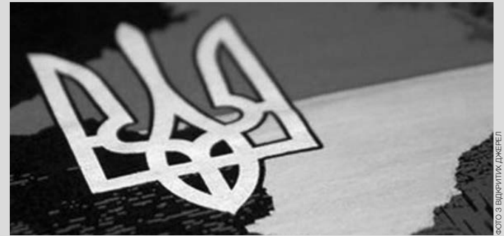
ФОТО З ВИКРИТИХ ДЖЕРЕЛ