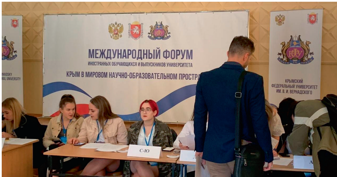
Міжнародний форум «Крим у світовому науково-освітньому просторі», за словами організаторів, об'єднав 59 держав, студенти яких навчалися і навчаються в «Кримському федеральному університеті», жовтень 2019 р.

У грудні 2018 р. «прес-служба КФУ» повідомила, що заснований ще у 1990 р. «перший науковий журнал університету» «Матеріали з археології, історії та етнографії Таврії», попри міжнародні санкції, було включено до науко-