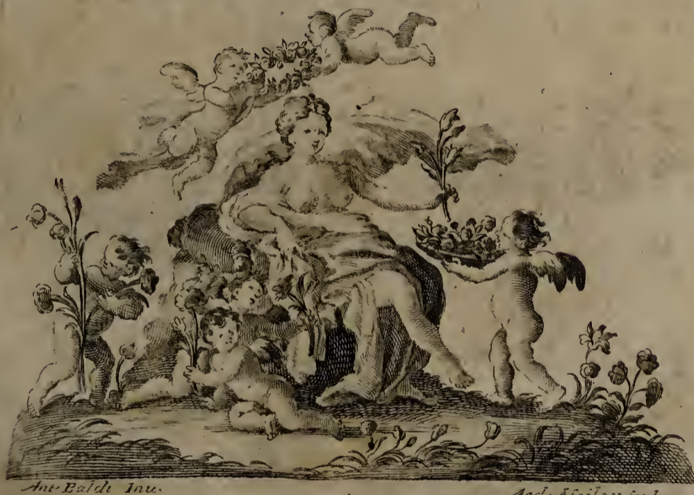
Ant. Baldi Inu.