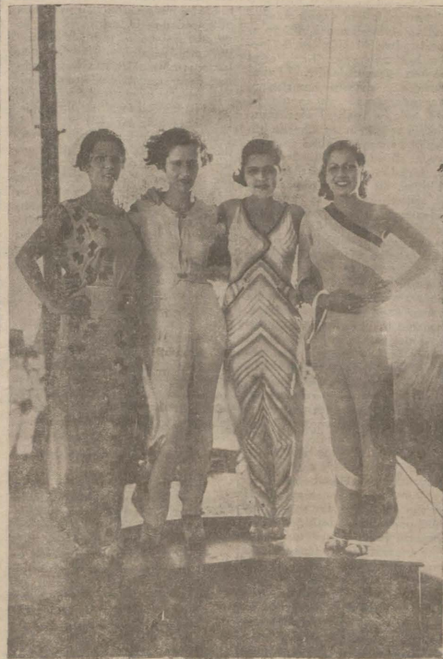
Karım beni aldatsa filmi artistlerinden dördü

ni kumandanın bir talih eseri olmak üzere iseer. Hofman o sıradaki 8 inci ordunun hareket şubesi müdürü idi ve Hindenburg ordusuna iltihak ettiği vakit yapılacak hareket hakkında bir takım plânlar hazırlamış bulunuyordu. Bu plânlar yeni kumandanın plânını şarki Prusyayı iki ordu ile Mazori göllerinin şimalinden ve cenubundan sararak istilâ etmekte. Bu iki Rus ordusundan birisi jeneral Rennenkampf ve diğeri jeneral Samsonov'un kumandası altında hareket ediyordu. Maamafih Rus ordularının ileri hareketi Fransayı tazyikten kurtarmak maksadile vaktinden evvel tacil edilmişti. Teşkilât nakıs ve kıtaatın sunun 26 sından 30 una kadar dört gün devam eden muazzam Mazori muharebesi neticesinde iki Rus ordusu mahvoldu. Almanlar bu muharebede 125,000 esir ve 500 top igtinam etmişler ve Rus ordularından birinin kumandanı bulunan jeneral Samsonov ricat esnasında intihar etmiştir.