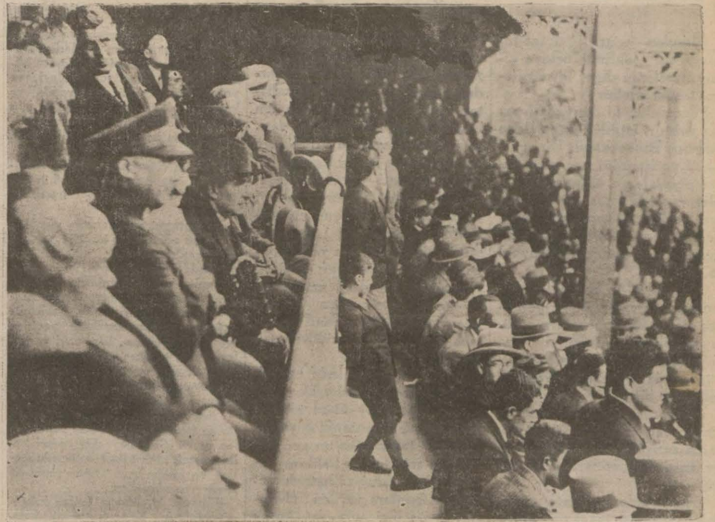
Başvekil dünkü maçı alâka ile takip ederken..

Reşit Galip Bey rinde görüşmüş ve uzun boylu tafsilât almıştır. Hocalar mektebin yükselmesi için düşündüklerini söylemişler ve bilhassa büyük bir kütüphanenin lüzumundan bahsetmişlerdir. Vekili Bey bu ihtiyacı daha geniş bir ölçü ile karşılamak için de düşündüğünü ve hattâ Ankarada bir millet kütüphanesi açmağa da taraftar olduğunu söylemiştir.