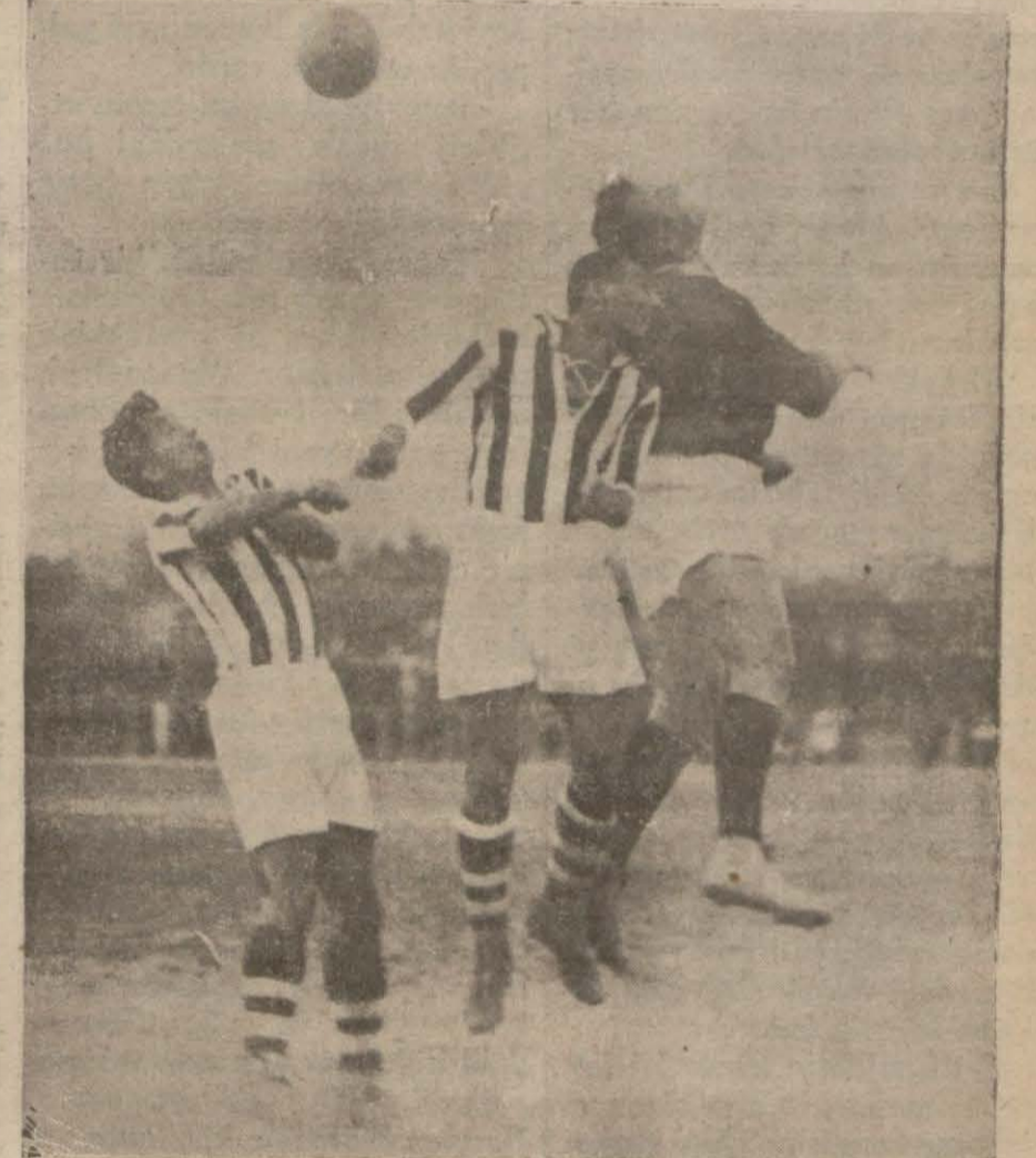
Maçın güzel bir enstantane