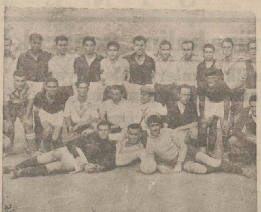
Karagüm rük - Selânik takımı maçtan evvel.

İkinci haftaym 4,25 te başladı. Oyun gene mütevazin, fakat seri. Selânik kaleisine inen Karagüm rük