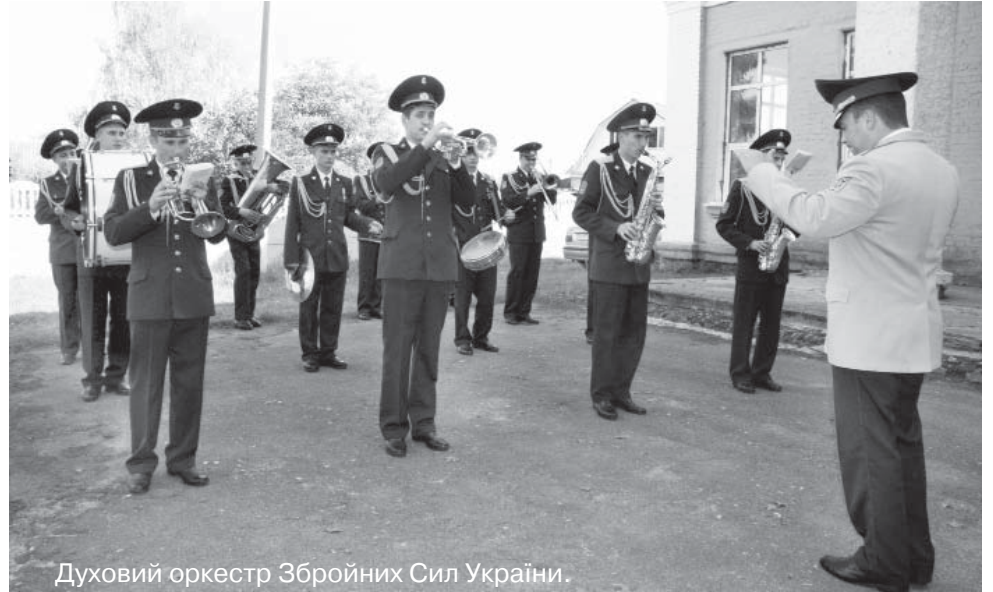
Духовий оркестр Збройних Сил України.

ціально підготовлений фільм про Ясногородку, який мали можливість першими переглянути присутні в залі. Щиро привітала односельчан