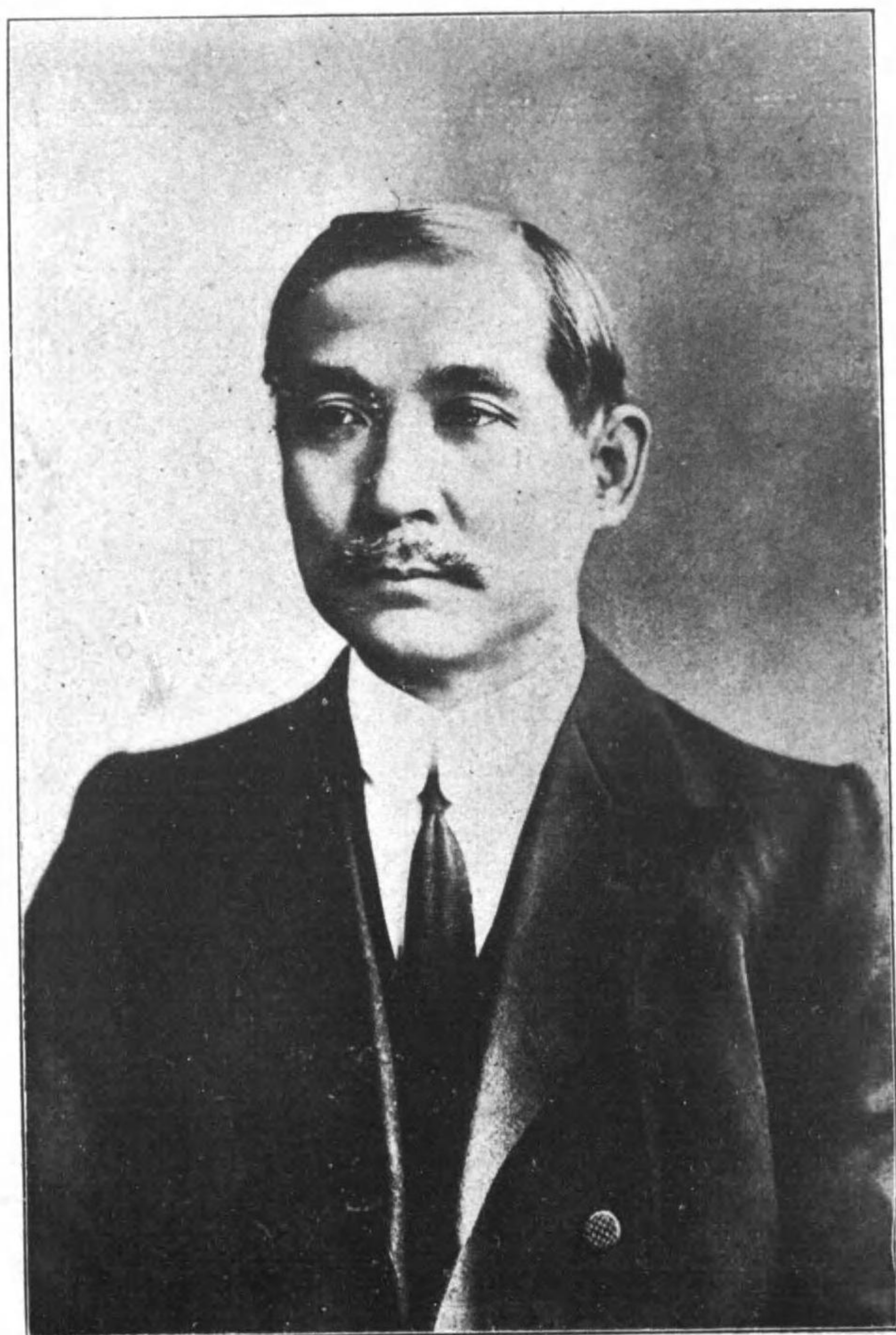
總 理 遺 像